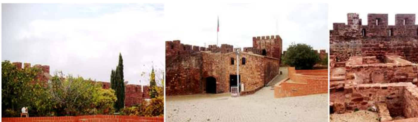
❸ Murallas cubiertas por la vegetación. ❹ Conjunto de las dos torres y la construcción que rodea la puerta de entrada. ❺ Sector de los baños con sus canalizaciones y letrinas

Y llegamos a la zona del palacio principal, ante el mismo están los restos de los complejos de los baños y la zona de la recepción.