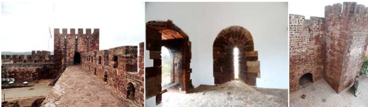
❶ El paseo de ronda hacia el torreón sobre la puerta de entrada. ❷ Interior de la sala superior del torreón. ❸ La puerta vista desde uno de los torreones que la rodean.

Con lo que concluimos todo el recorrido perimetral de sus murallas. Finalizando su visita.