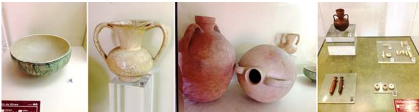
❶ Cuenca cerámica decorada S. XIII. ❷ Jarra cerámica S. XIII. ❸ Ánforas, cerámica S. XIII ❹ Jarra, piezas de hueso, Frascos de vidrio, etc. S. XIII