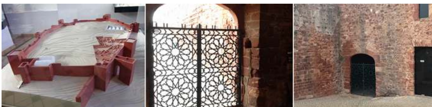
❶ Parte opuesta de la maqueta. ❷ Bonita celosía de forja en uno de sus arcos de esta estancia interior junto a la puerta. ❸ Construcción junto a la puerta donde está la recepción y una pequeña exposición.

Tras sacar los billetes con la visita incluida del Museo Arqueológico y tomar algunos folletos, emprendemos la visita interior del castillo.