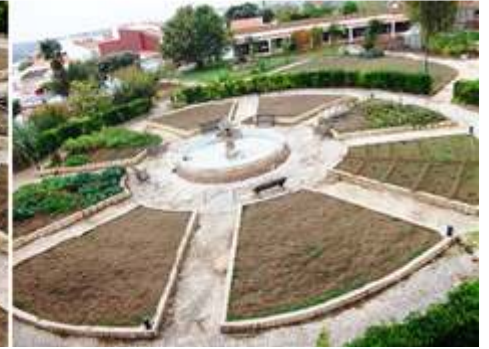
1 Todo el contorno del castillo es visitable por su paseo de ronda. 2 La rotonda con una fuente central. 3 En su pavimento se puede leer Silves.