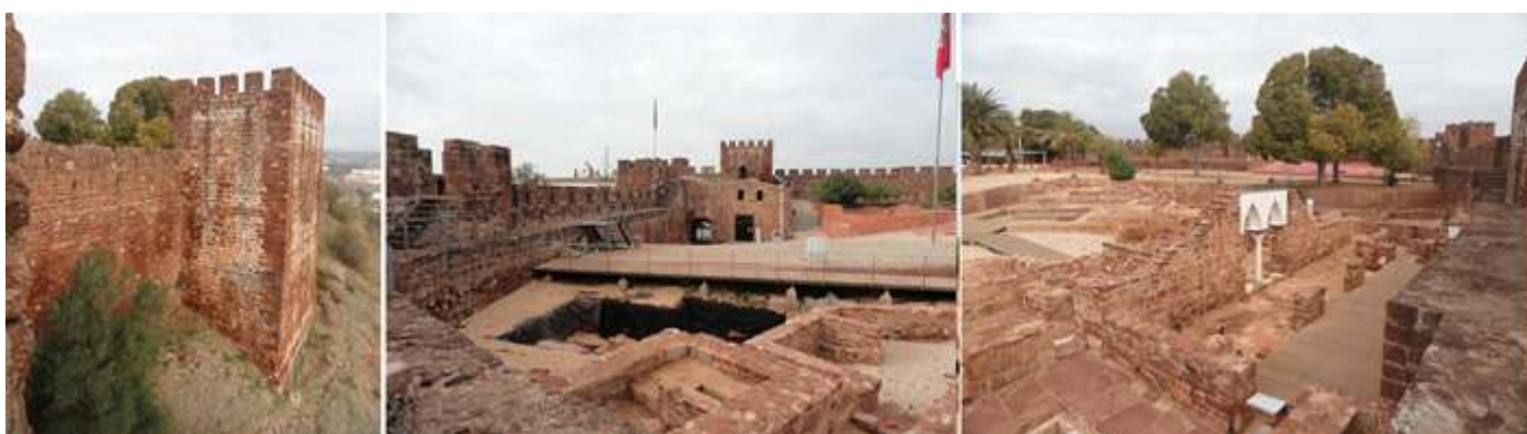
❶ Uno de los torreones exteriores. ❷ Desde el paseo de ronda, la zona de las excavaciones. ❸ Esta es la zona donde existió el palacio musulmán.

Con lo que concluimos todo el recorrido perimetral de sus murallas. Finalizando su visita.