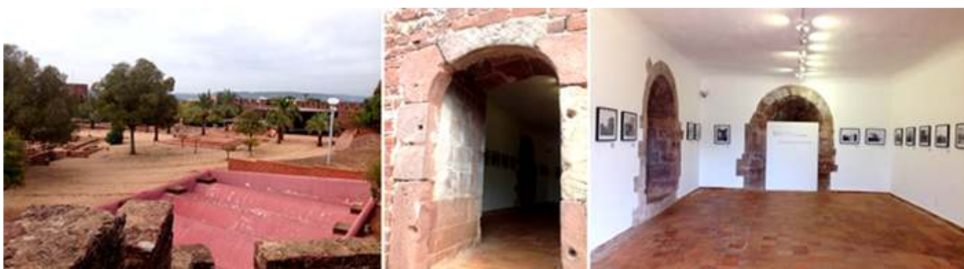
❶ Las bóvedas del aljibe principal. ❷ Puerta de acceso a uno de los torreones. ❸ Donde se encuentra una exposición fotográfica.

En una de sus torres se exponen los objetos fruto de las excavaciones realizadas desde 1984 donde se encuentran diversas muestras desde el S. VIII hasta el XIII.