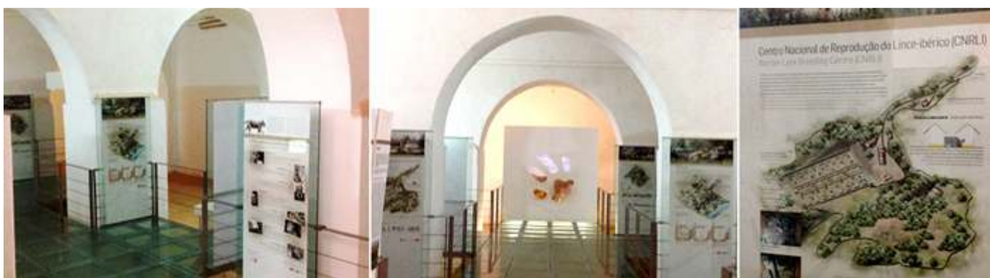
❶ Exposición mediante paneles gráficos. ❷ Dispone de seis pilares centrales que sostienen sus bóvedas de cañón. ❸ Centro de reproducción de Lince Ibérico

Este aljibe facilitaba el agua a la ciudadela y a la ciudad hasta poco tiempo, tiene una capacidad de un millón trescientos mil litros para abastecer a 12.000 personas durante un año.