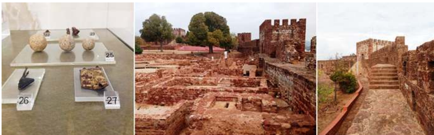
❶ Puntas de Flecha, Balas de piedra, punta de puñal, etc. S. XIII. ❷ Basamentos de las construcciones junto al palacio. ❸ Paseo de ronda que en algunos tramos posee algunas escaleras.