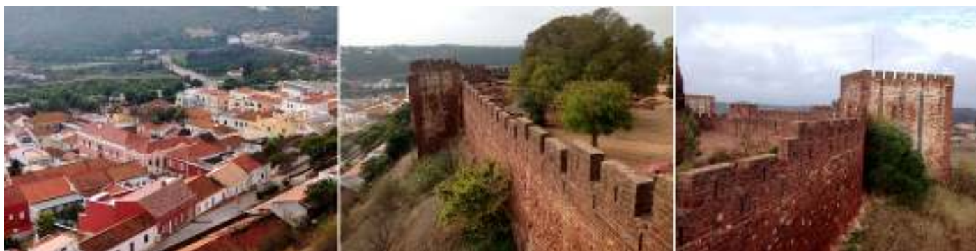
❶ Desde cualquier parte de la muralla se divisa a los pies la ciudad. ❷ Toda la muralla en este lado dispone de un gran desnivel del terreno. ❸ Algunas torres (cuatro) tuvieron alteraciones en los S. XIV y XV y presentan salas abovedadas y puertas góticas. Murallas de la zona norte.