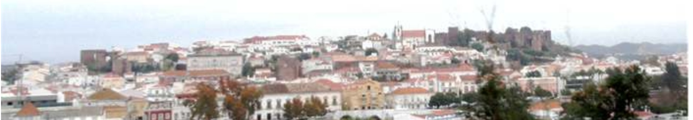
1 Panorámica de Silves.

Silves es un municipio del distrito de Faro, provincia y región de Algarve, en Portugal. Y se extiende desde la sierra hasta el mar. Su historia se remonta a unos 3000 años fue habitada por fenicios, cartagineses y posteriormente por los romanos y los árabes. La ciudad se desparrama desde la colina al rio Arade.