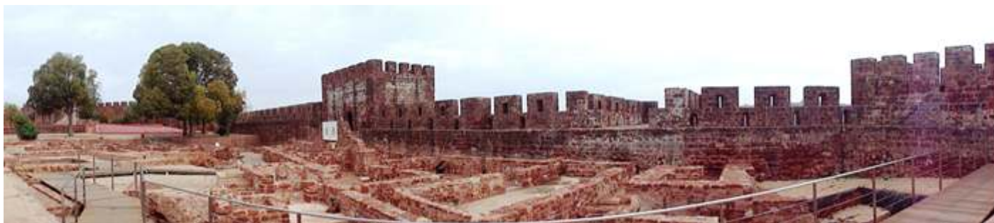
❷ Panorámica con los basamentos de las construcciones en las que se han efectuado las excavaciones junto al palacio.

La parte arqueológica visitable se encuentra alojada al este donde están los palacios almohades que están junto a la muralla.