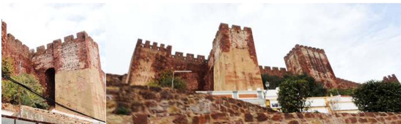
❶ Torre albarrana unida por un arco a la muralla. ❷ Otra imagen de esta torre frontal, y los dos torreones laterales.

Tras concluir la visita del castillo, bajamos por la calle Largo José Correia Lobo. Y estamos junto a la catedral. Podemos mantener el coche aparcado y realizar las visitas a pie para mayor comodidad.