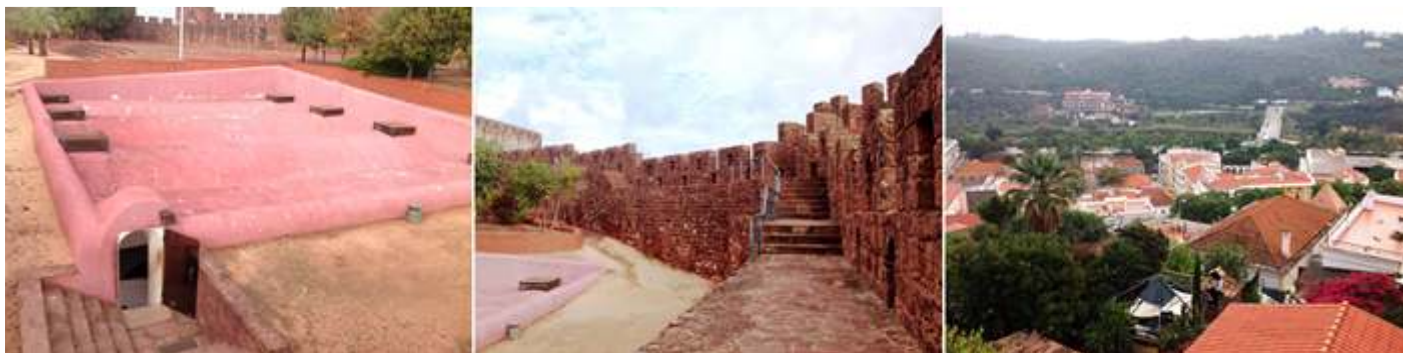
❶ Bóvedas exteriores de los aljibes. ❷ Accedemos a la muralla para recorrerla por su paseo de ronda. ❸ Y tomar distintas vistas de Silves desde esta perspectiva.