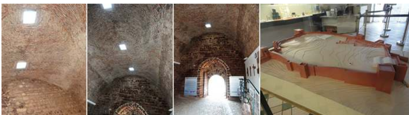
❶ Bóveda con lucernarios en la sala comprendida entre la puerta de entrada exterior y la interior del castillo. ❷ Es una sala muy amplia con bóveda de cañón apuntado. ❸ En el lateral izquierdo según se entra esta la recepción con una pequeña sala expositiva. ❹ Maqueta con el perímetro del castillo donde se aprecia el área excavada, las cisternas y silos que poseía.

Esta es la puerta principal orientada hacia la medina con doble puerta, y había otra salida más pequeña orientada al norte que daba al exterior, conocida como la puerta de La Traición.