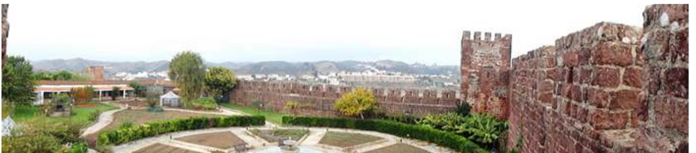
1 Panorámica de esta parte interior del castillo con un gran rotonda ajardinada.

Y recorriendo el camino de ronda llegamos al torreón(es) que están sobre la puerta principal.