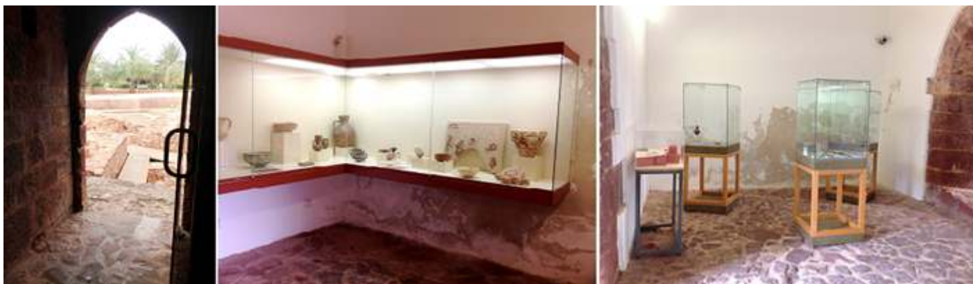
❶ Entramos en la torre frente al palacio donde están las piezas procedentes de las excavaciones. ❷ Vitrinas con los objetos expuestos. ❸ Otras más pequeñas.

En su vitrinas se exponen objetos de loza y cerámica, restos de estucos, algún capitel, cuentas y adornos personales, puntas de flechas y ballestas, etc.