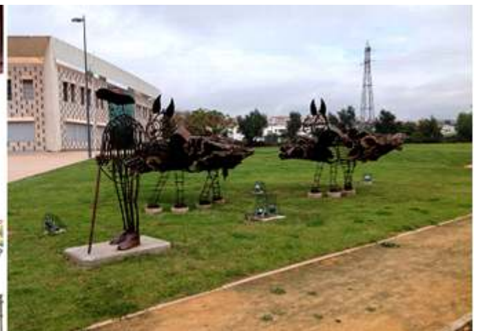
1 La Cruz de Portugal, por su piedra mantiene una blanca calcárea. 2 Otra imagen con la parte posterior de la Piedad. 3 Junto a la Cruz hay unos jardines junto a la N-124 representado a un campesino con dos mulos cargados de cortezas de corcho.