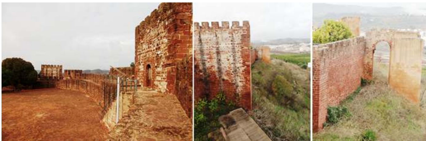
❶ Otro de los torreones. ❷ Este en concreto es una torre albarrana. ❸ Otra de las torres albarranas, está unida por un arco.

En las últimas excavaciones se ha localizado la residencia del alcaide del castillo, el infante Don Enrique