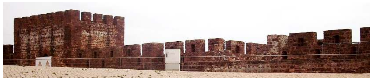
❶ Primera visión tras pasar la puerta de castillo.

Sobresalen cuatro de sus torres: cuatro torres: la del Centro, la de las Mujeres (por haber servido de cárcel de mujeres), la del Homenaje, también conocida por el nombre de Aben-Afan) y la del Secreto (donde se metían a los presos incommunicables).