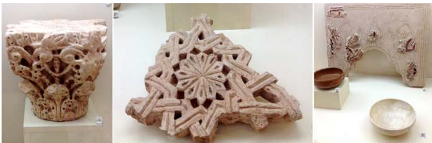
❶ Capitel, mármol S. XIII. ❷ Estuco de cal y arena S. XIII. ❸ A fondo: Arcaía de cal y arena S. XIII. Cuenco cerámica S. XIII, y otro Cuenco cerámica blanca S. XIII

En los últimos años del siglo pasado y principios del presente, se ha realizado campañas arqueológicas, que han aportado elementos de los objetos y edificaciones del periodo califal.