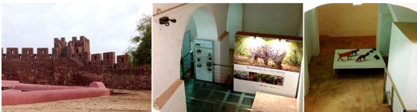
❶ Disponía de tres cisternas siendo la más grande esta que vamos a visitar ❷ Su interior alberga una exposición sobre el Lince Ibérico. ❸ Con algunas maquetas.

Colindantes están los antiguos aljibes que sus bóvedas exteriores están pintadas de granate, y que actualmente en su interior hay una exposición sobre los Lince.