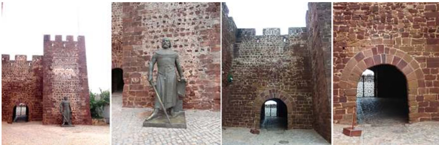
❶ Su entrada entre dos torreones de planta cuadrada. ❷ A la entrada una escultura de bronce del rey Sancho I que representa la toma de la fortaleza. ❸ Puerta de entrada. ❹ De medio punto con un arco de medio punto con dovelas lisas.

Esta es la puerta principal orientada hacia la medina con doble puerta, y había otra salida más pequeña orientada al norte que daba al exterior, conocida como la puerta de La Traición.