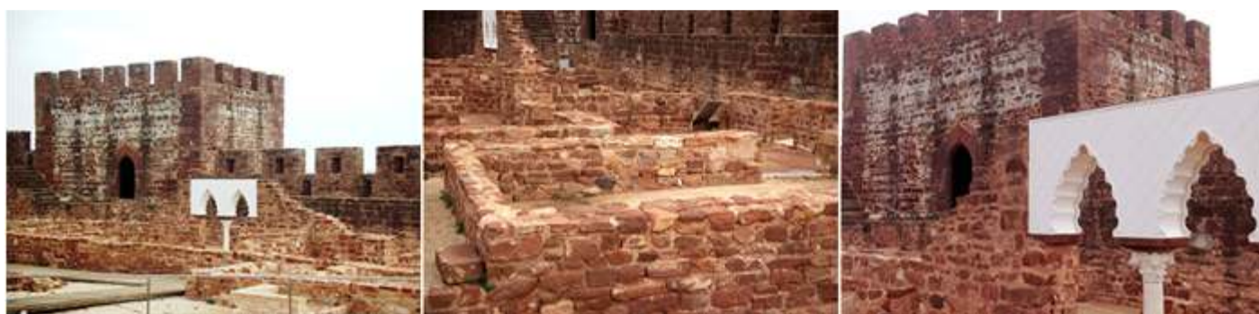
❶ El palacio constaba de dos plantas con un espacio público y otro privado que se articulaban a sendos patios cuadrados. ❷ Basamentos tras las excavaciones. ❸ Esta zona pertenecía al área privada del palacio.

El palacio Almohade fue fundado en e S. XII y en la centuria siguiente ampliado y remodelado. Realizado por el último rey musulmán Ali ben Yusuf y su heredero Emir Sir (1128-1139)