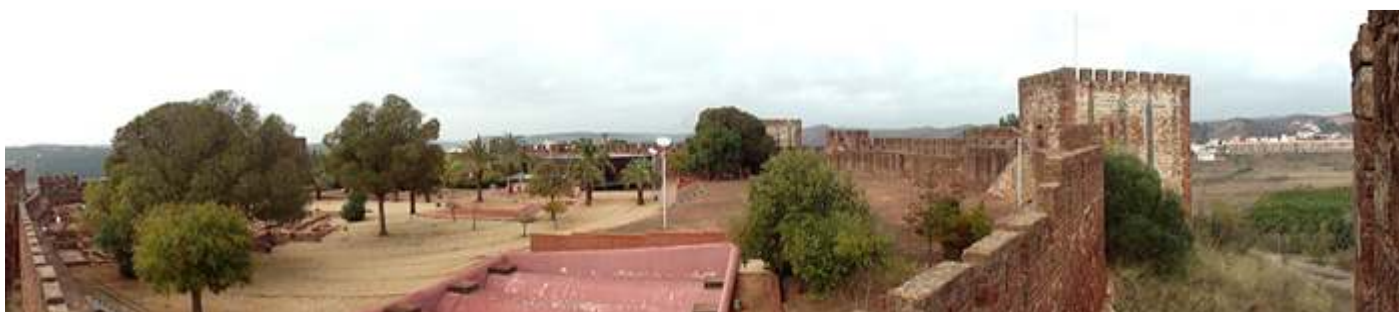
❶ Panorámica con las bóvedas del aljibe en primer plano

En las últimas excavaciones se ha localizado la residencia del alcaide del castillo, el infante Don Enrique