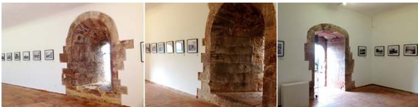
❶ Fotos retrospectivas sobre el castillo. ❷ Su ventana con una gran abocinamiento con derrame interior. ❸ Puerta de acceso a esta sala.

En una de sus torres se exponen los objetos fruto de las excavaciones realizadas desde 1984 donde se encuentran diversas muestras desde el S. VIII hasta el XIII.