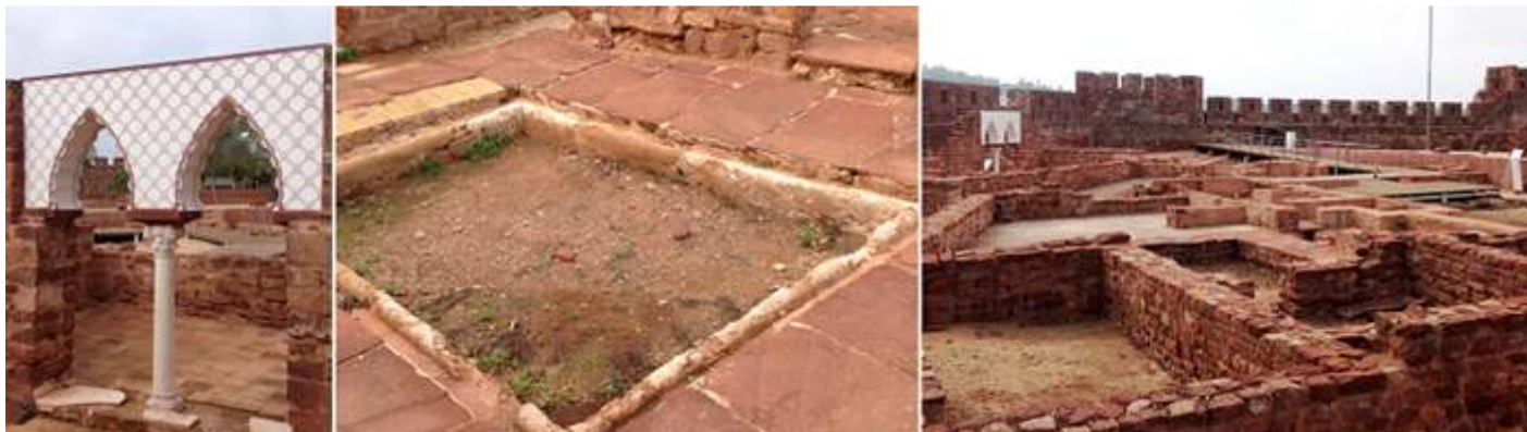
❶ Reconstrucción de unos arcos del palacio. ❷ Uno de los patios. ❸ La zona pública contaba con un patio que estaba y se comunicaba con la torre.

A partir del patio también tenía acceso a la casa de baños, con jardín, que poseía una canal para recoger las aguas pluviales, a partir de allí estaban los diversos departamentos: sala, cocina, despensa, complejo de baños. Etc.