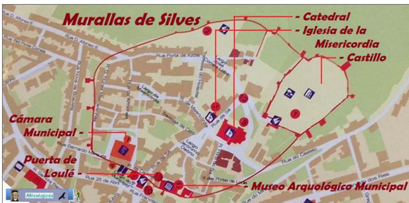
Croquis itinerario visitas, plano empleado de un folleto turístico de Silves.