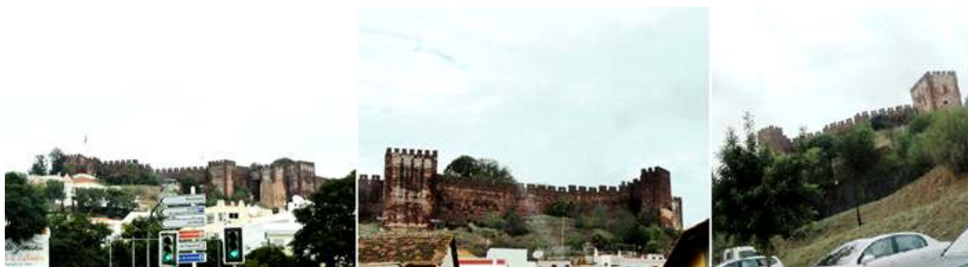
❶ La línea o silueta del castillo sobre la localidad de Silves. ❷ Murallas desde la Rúa del Cementerio. ❸ Por la carretera que asciende al castillo. Importante está muy limitado el aparcamiento en la zona próxima al castillo.

Castillo de origen almohade que posteriormente tuvo reformas cristianas, por el que se accede por una puerta alojada entre dos torreones de planta cuadrada, ocupa una superficie de unos 12.000 m2 dispone en su perímetro de once torres dos de ellas albarranas.