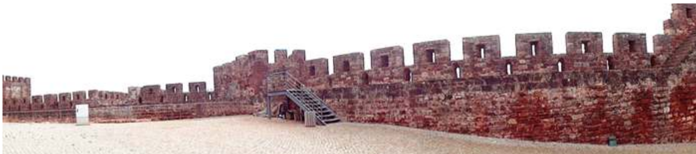
❶ Línea de la muralla con sus almenas abiertas por las aberturas de las saeteras.

La parte arqueológica visitable se encuentra alojada al este donde están los palacios almohades que están junto a la muralla.