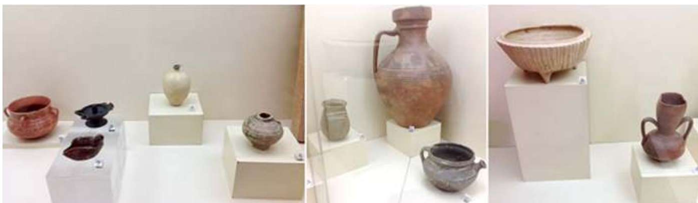
❶ Jarra, Lucerna, Balsamario, Lamparilla. S. XII-XIII ❷ Búcaro, Cántaro, y Cuenco cerámica S. XII y XIII. ❸ Trípode y Jarra cerámica S. XIII.

Además de estos objetos, el en Museo Municipal Arqueológico, se muestran más piezas y entre ellas: cerámica del Periodo Omiada S. VIII-IX. Placa Apotropaica almohade, los objetos del Período Califal en el S. X, objetos del Periodo Almohade S. XIII, etc.