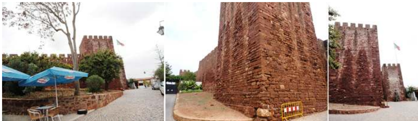
❶ Última rampa de acceso ❷ Una de las esquinas del castillo. ❸ Y al fondo los torreones con la puerta de acceso..

Su construcción es a base de piedras irregulares de color rojizo, cascotes y argamasa