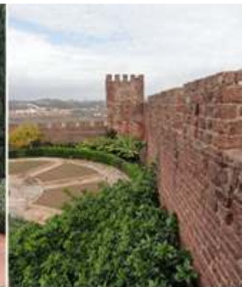
1 El espacio ajardinado. 2 Que dispones de algunas esculturas. 3 Que está junto a uno de los muros del castillo.