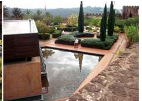
1 Vista con el fondo de la torre de la catedral. 2 Un estanque sobre una construcción de servicios. 3 Esta parte del castillo está ajardinada.