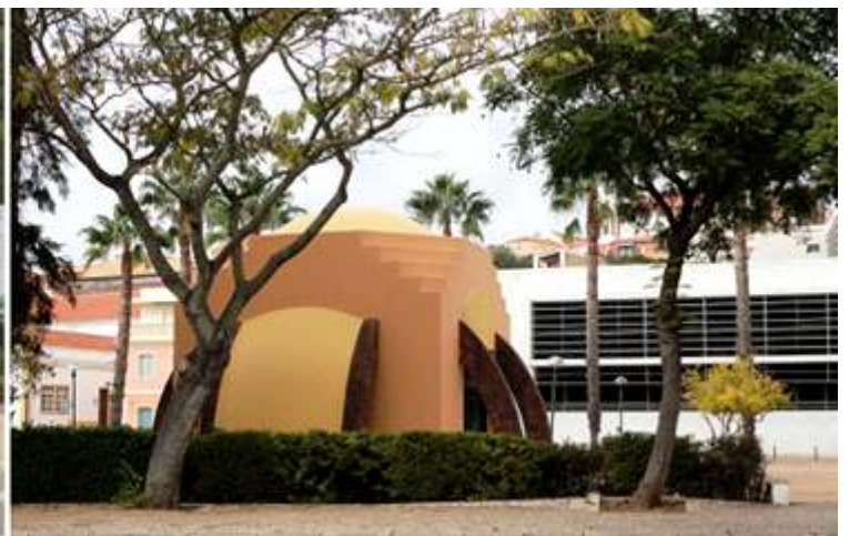
1 Entrada en Silves. 2 Monumento a Al- Mutamid. En la plaza del mismo nombre. Al-Mutamid fue uno de los poetas más importantes de al-Andalus. En la misma hay un mural que exhibe fragmentos de su poema la evocación a Silves.

Silves capital del arte almohade, a pesar de estar situada en un eje crucial en la ruta que, partiendo de Sevilla, unía la costa algarvía de una punta a otra, Silves solo alcanzó protagonismo a partir del S. XII.