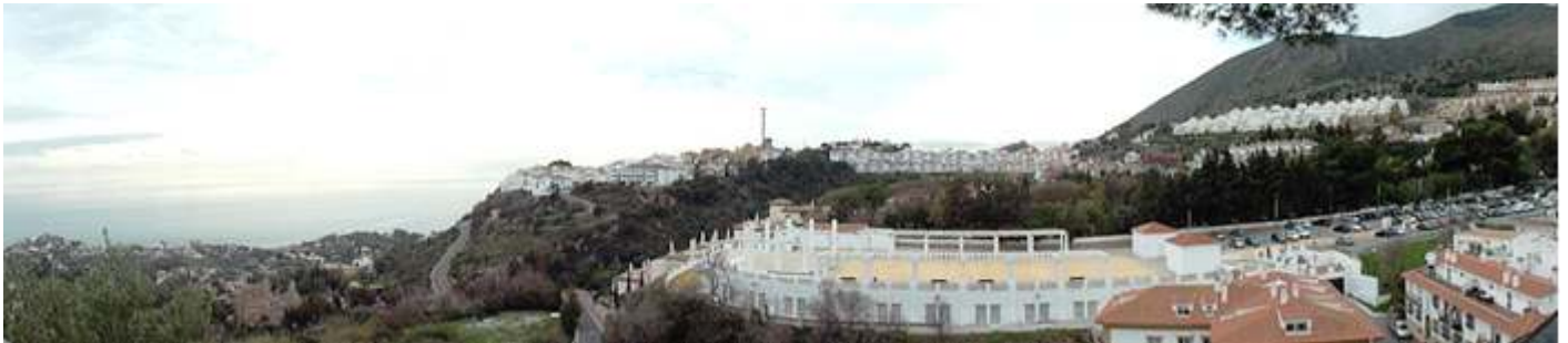
❶ Está asentada en una loma de la Sierra de Mijas. Una de sus excelentes panorámicas.

Situada en la Costa del Sol Occidental y a tan solo 22 de la capital (Málaga) y tiene la particularidad de desdoblarse para ser un pueblo marinero y de montaña. Con un pasado prehistórico como lo atestiguan sus hallazgos arqueológicos de las en las cuevas de Zorrera, Botijos y Toro. Y destacando por su pasado árabe por su riqueza minera. (El nombre del pueblo significa en árabe “hijos de las Minas”).