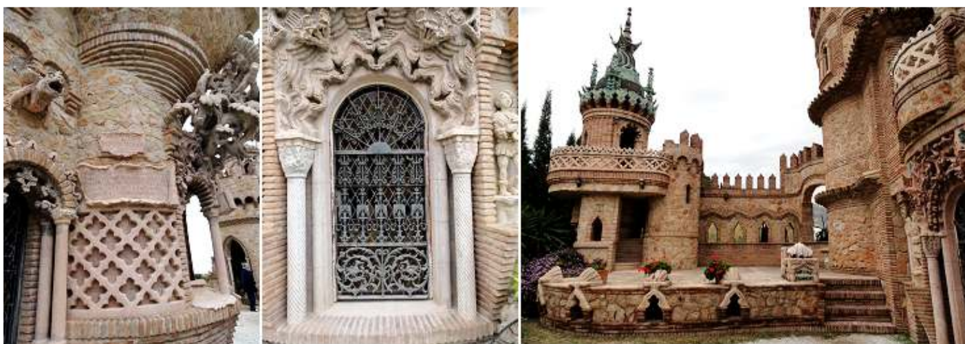
❶ En este lateral está escrito un párrafo del Testamento de Isabel la Católica, la cláusula XXIV. ❷ Ventana de la Capilla con la F de Fernando el Católico de 1,96 m2. ❸ Una de las terrazas ante el castillo.