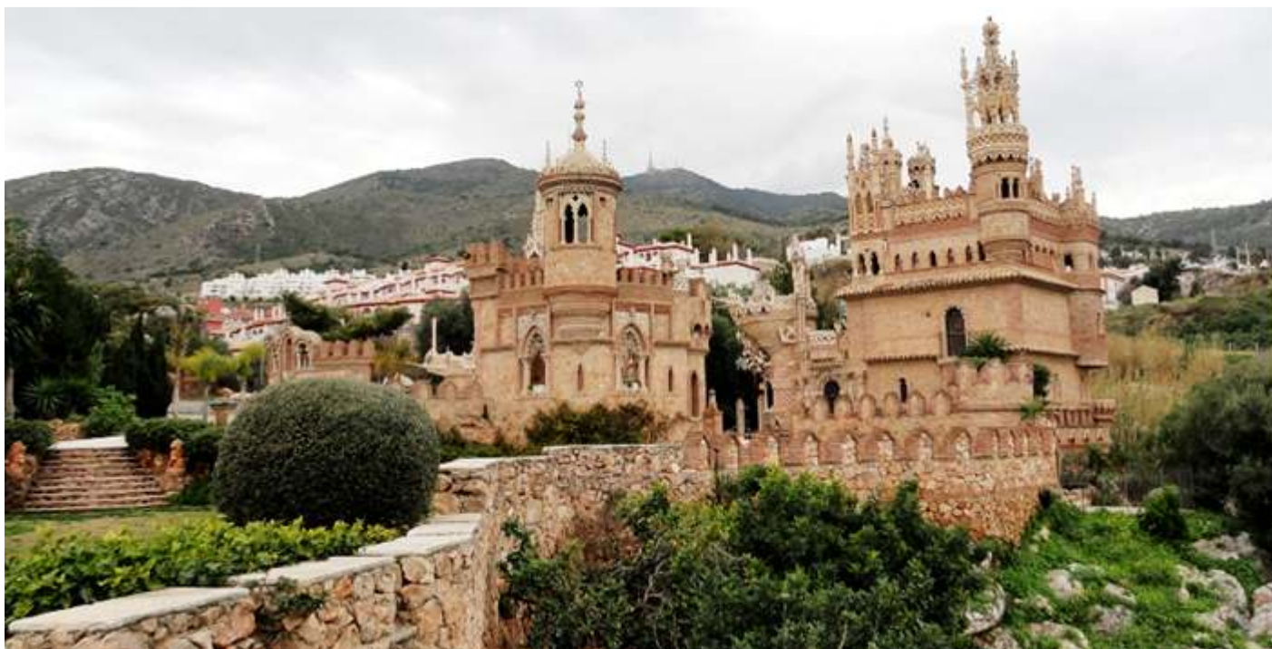
❶ El castillo desde los jardines.

En el lateral derecho se adentra uno en el jardín de la finca que posee un muro de contención, que hace también de mirador.