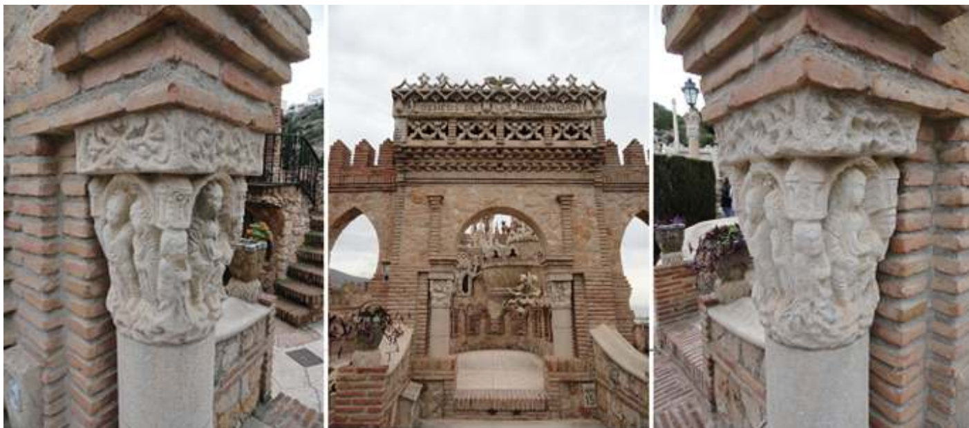
❶ Capitel de esta portada en el lado izquierdo historiado con escenas religiosas. ❷ Portada que en su parte superior reza: Génesis de la Hispanidad. ❸ Capitel del lado derecho.

En su construcción se suceden los estilos bizantino, románico, gótico y mudéjar.