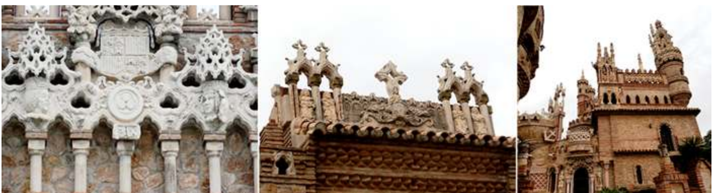
❶ Frontal de de la portada y las testas de los reyes. ❷ Balaustrada superior del castillo. ❸ Y una imagen de este lateral