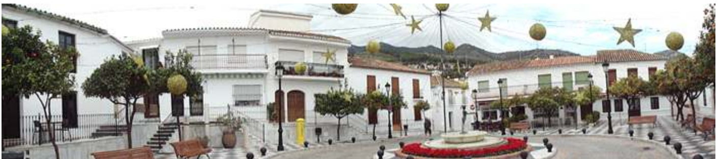
❶ La plaza de España, donde en verano se llena de terrazas de los bares.

El núcleo de su zona antigua merece una vista pausada recorriendo sus calles y plazas donde nos envuelve un ambiente andaluz de sus casitas encaladas y decoradas sus fachadas con flores, lo mismo que sus patios.