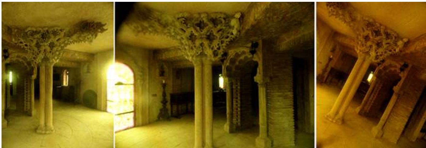
❶ Instantáneas de la planta inferior del castillo a través de sus cristales. ❷ Posee arcos polilobulados y en sus columnas una amplia decoración que se desparra por el techo. ❸ Detalle de una columna agrupada.

La Gesta de Cristóbal Colón se realizó debido a su gran fe en el proyecto y que otros estados no lo aceptaron, salvo los Reyes Católicos. Fue un gran navegante ilustrado en geografía, astronomía, matemáticas, humanidades y Sagradas Escrituras.