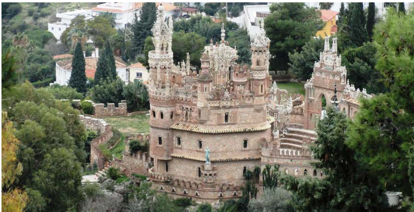
1 Toma del castillo desde los miradores de los Jardines del Muro

Iniciamos un recorrido por el exterior del mismo, pues salvo a las terrazas de la entrada, no se accede a su interior.