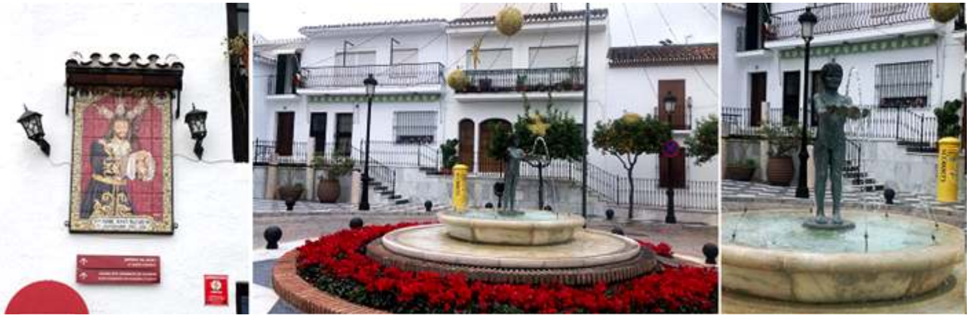
❶ Retablo de azulejos Nuestro Padre Jesús Nazareno. ❷ Fuente en la parte central de la plaza. ❸ Escultura de la Niña de Benalmádena, obra del escultor Jaime Fernández Pimentel.

Nos ubicamos en la Avda. de Juan Luis Perales de Benalmádena Pueblo, y tomando la Avenida de los Chorrillos, vamos descendiendo. Al llegar a este punto, pues no existen indicadores, cosa incompresible.... Finca la Carraca, Ctra. Costa del Sol, s/n. Se tiene que aparcar en la carretera antes de llegar a él,