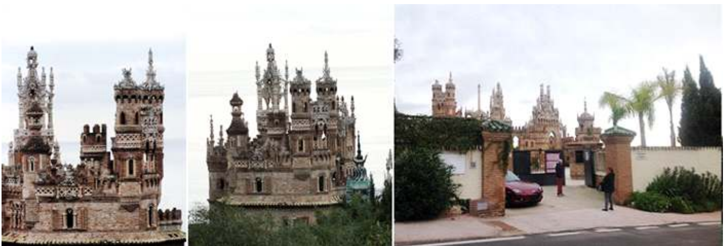
❶ Unas tomas bajando por la carretera. ❷ Luego en el parque superior tiene mayor perspectiva. ❸ Entrada al castillo.

Este castillo construido recientemente entre los años 1987 y 1994, que narra la historia del descubrimiento de América de forma simbólica.