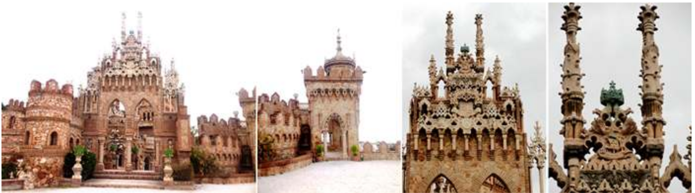
❶ El castillo en si por su parte frontal se encuentra rodeado por una portada y sendos torreones laterales. ❷ Uno de los torreones con planta cuadrada. ❸ Parte superior de la portada con el escudo de los Reyes Católicos y a sus lados esta reproducidas sus cabezas. ❹ Crestería superior con un navío y una corona sobre la misma.

A este doctor le motivo su realización dado el escaso conocimiento que tenían los americanos sobre la historia del Descubrimiento.