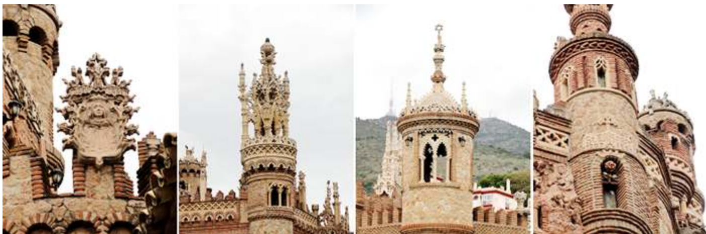
1 Medallón con a fecha de nacimiento de Isabel La Católica 22.IV.1451. 2 Torreón circular de varios cuerpos entre sus adornos ostenta los escudos de Castilla y León, y coronado con la bola del mundo con la frase Non Plus Ultra, sobre unos caballitos de mar. 3 Otro torreón redondo distinto a los demás. 4 Torreón sobre la fachada de la capilla con la inscripción en húngaro de St. Erzsebet 1207-1231. (Santa Isabel de Hungría) a la izquierda de si inscripción hay un delicado relieve de una reina con un niño.

Recorremos ahora su parte posterior que esta elevada sobre una roca.