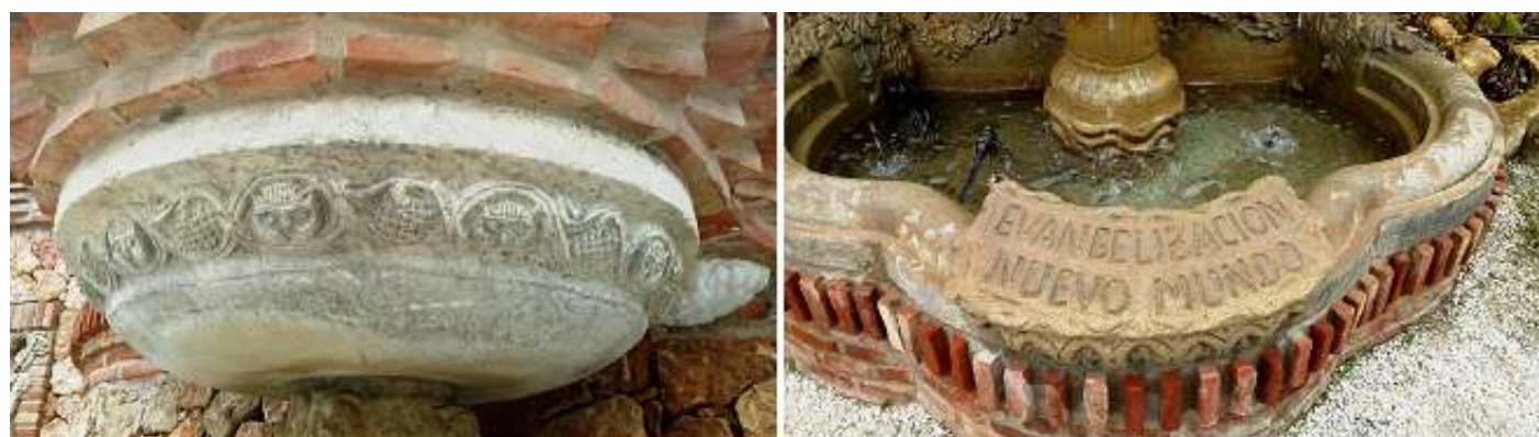
❶ Capitel sobre la columna que sustenta la fuente con unos roleos que contienen caras de lechuzas? Y piñas alternativamente. ❷ Poza de la fuente con una cartela en piedra: Evangelización Nuevo Mundo.

Los motivos decorativos están por doquier.