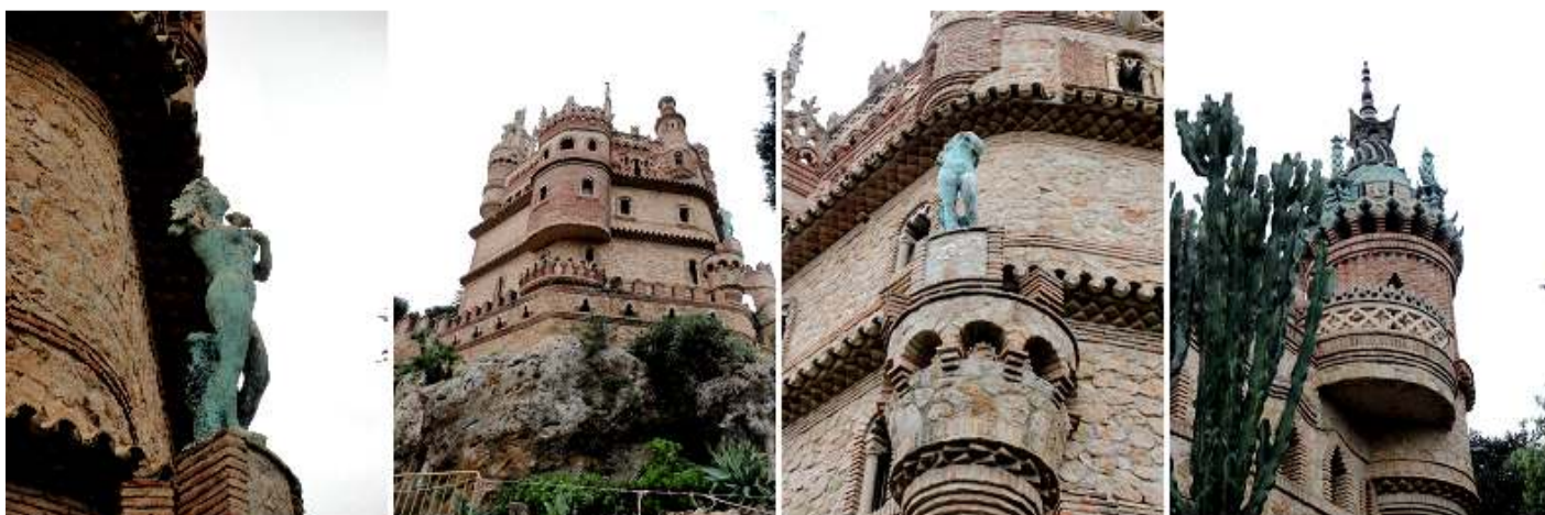
1 Estatua de bronce de un desnudo femenino. 2 Desnivel posterior. 3 Caprichos constructivos podemos apreciar por doquier. 4 Donde las labores de piedra se compenentran con las decoraciones en ladrillos.

Recorremos ahora su parte posterior que esta elevada sobre una roca.