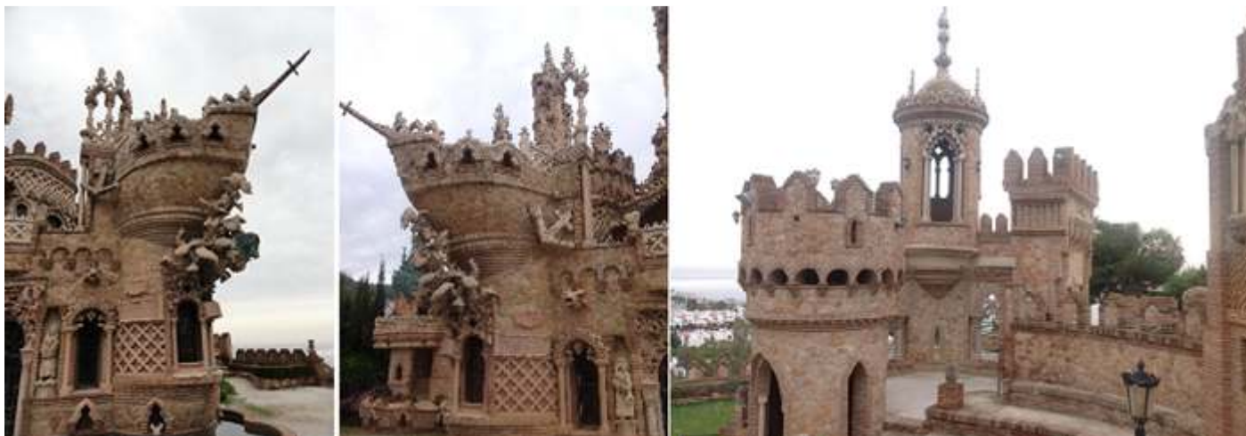
❶ - ❷ Imágenes de la nao de la entrada por ambos lados de la misma. ❸ Parte superior del castillo, tomada desde los jardines del Muro.

Y damos por concluida la vista, para seguir conociendo este lugar preferido por miles de turistas cada año.