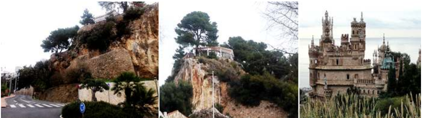
❶ En este cruce tomaremos en camino (carretera) a nuestra espalda ❷ Y si volvemos la vista a tras veremos la parte superior del Parque del Muro. ❸ Y la silueta del castillo.

Nos ubicamos en la Avda. de Juan Luis Perales de Benalmádena Pueblo, y tomando la Avenida de los Chorrillos, vamos descendiendo. Al llegar a este punto, pues no existen indicadores, cosa incompresible.... Finca la Carraca, Ctra. Costa del Sol, s/n. Se tiene que aparcar en la carretera antes de llegar a él,