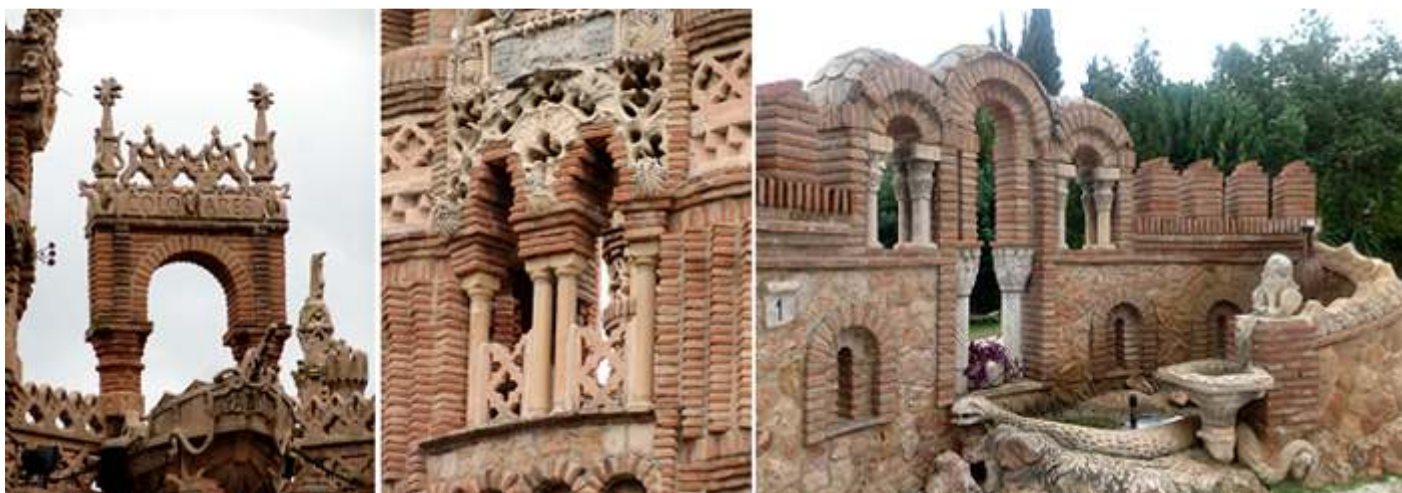
❶ Arco de ladrillo y en su entablamento la inscripción: Colomares bajo su crestería. ❷ Ventana con doble arco y sobre el mismo un friso con la caras de los Reyes Católicos y sobre cada capitel la proa de una nao. ❸ Otro rincón de esta parte que antecede al castillo con una fuente y fachada posterior con tres arcos de medio punto

En su construcción se suceden los estilos bizantino, románico, gótico y mudéjar.