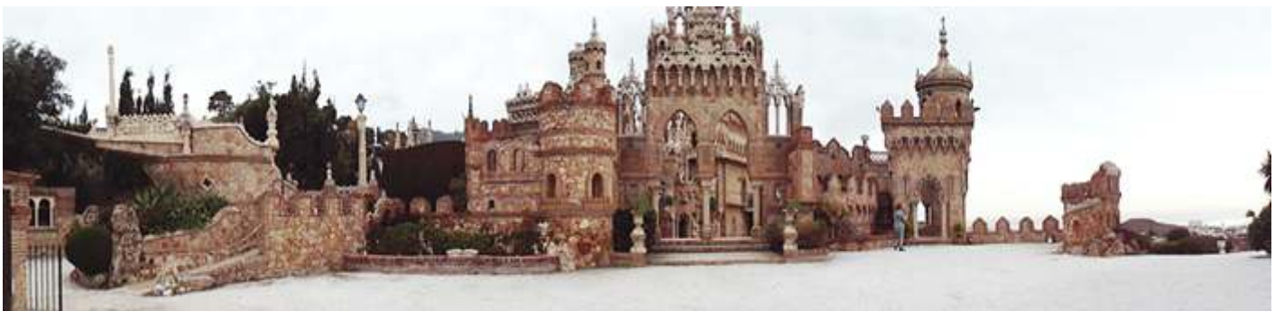
❶ Panorámica del patio de la entrada.