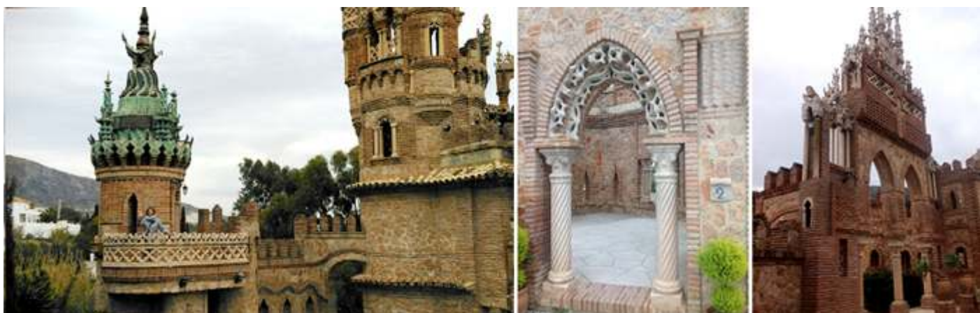
❶ Espacio entre una parte del perímetro y el castillo con un torreón con una original cúpula. ❷ Puerta de arco apuntado que tiene una labor de calado del mismo. ❸ Perspectiva del doble arco de entrada.