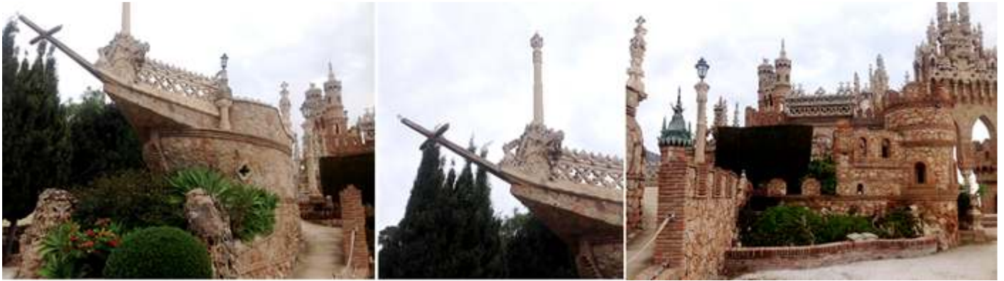
❶ Entrada con la proa de una nao que hace de balcón ante la misma. ❷ Todas las figuras y construcciones están identificadas con el viaje del Descubrimiento de América por Colón. ❸ El castillo construido con piedra, cantería y ladrillo.