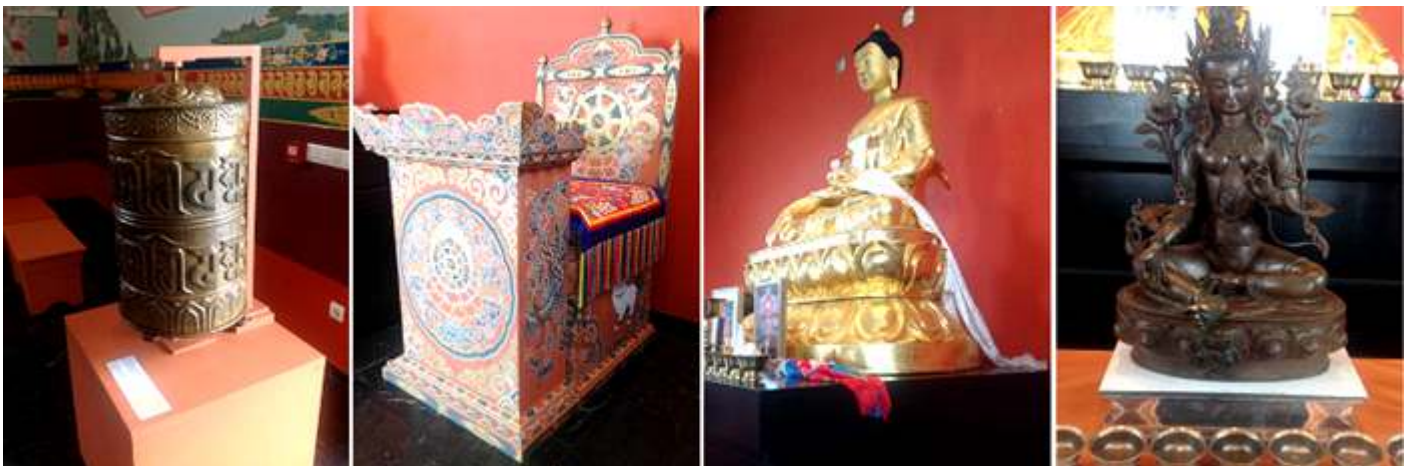
❶ Molinillo Mani.- Molinillo ritual de bronce relleno de oraciones impresas en papel. Al girar el molinillo, las oraciones con los buenos deseos se extienden por el entorno para el bien de todos los seres, ❷ Trono de oficiante. ❸ Estatua completamente dorada salvo su cara y en posición sedente sobre sus piernas plegadas. ❹ Estatua de otra divinidad.

En un extremo de la localidad, el año 1994 el Maestro Budista proveniente del Reinado de Bután, Lopon Tsechu Rinpoche, impulsó la construcción de la primera estupa en España.