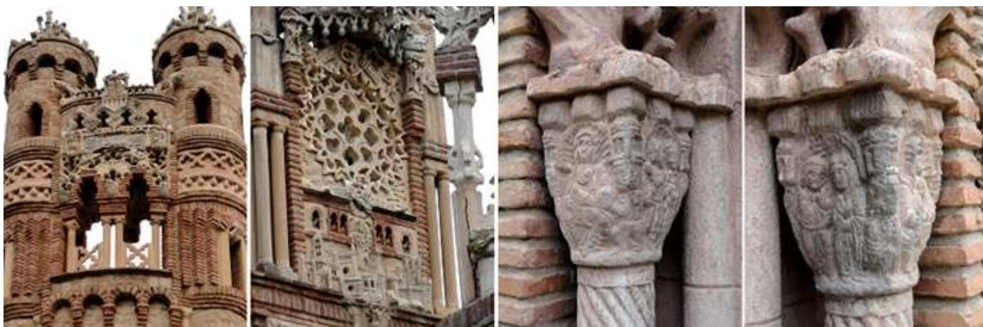
❶ Parte frontal del castillo formando un balcón. ❷ Rosetón gótico como mausoleo de Cristóbal Colón. ❸ Capitel que en esta cara parece representar la Epifanía con los Reyes Magos. ❹ Y en este la Sagrada Familia.

En los bajos dispone de una pequeña capilla, “la más pequeña del Mundo”