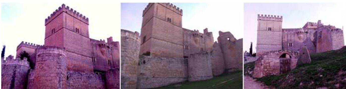
❶ La zona sureste del castillo con dos torres, con ventanas geminadas. ❷ Donde destacan sus grandes torres cuadradas de las cuatro que poseía en sus ángulos solo se conservan dos. ❸ Panorámica culminado su construcción sobre la loma.