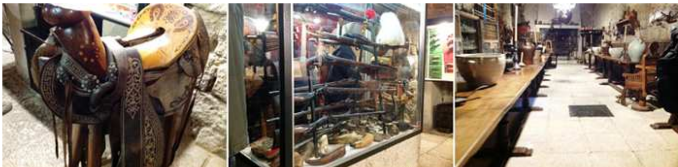
❶ Otra silla de montar con labores de repujado mejicana. ❷ Vitrina con fusiles y escopetas. ❸ Sala con objetos etnográficos.

La cocina del castillo está dedicada a la Etnografía y artes populares con lo referente a la vida cotidiana del campo.