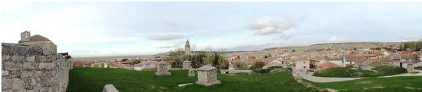
1 Una bella perspectiva del horizonte, y ante el castillo las bodegas y chozos.