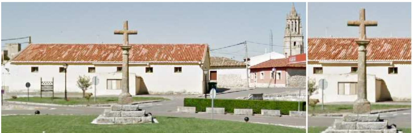
1 Crucero en la rotonda donde confluye la P-904 con la P-901. 2 Crucero sobre un estrado de escalones con una columna redonda y una cruz desnuda con brazos iguales (griega).

Antes de la invasión musulmana era una localidad pujante, las los árabes en la reconquista fue repoblada. En el S. XV paso al poder feudal de Pedro García de Herrera que fue Mariscal de Castilla.