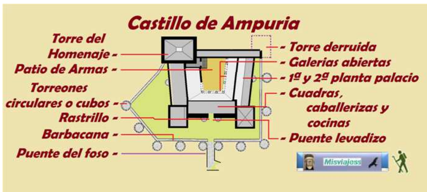
1 Croquis del castillo, realización propia.

La colección continúa en la Torre del Homenaje con otras salas para los recorridos “Secretos” con grupos muy reducidos siguiendo después en otras dependencias y salones.