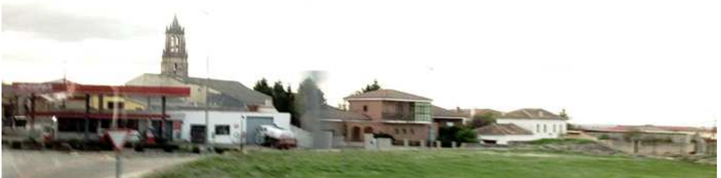
1 Panorámica a la entrada de la Villa.

Localidad que pertenece a la comarca de Tierra de Campos. Debió de fundarse con la ocupación romana hacia el S. II ó I a.C. cuando la poblaron tras la campaña con los Vacceos. Es una villa muy antigua que llegó a tener sede episcopal.