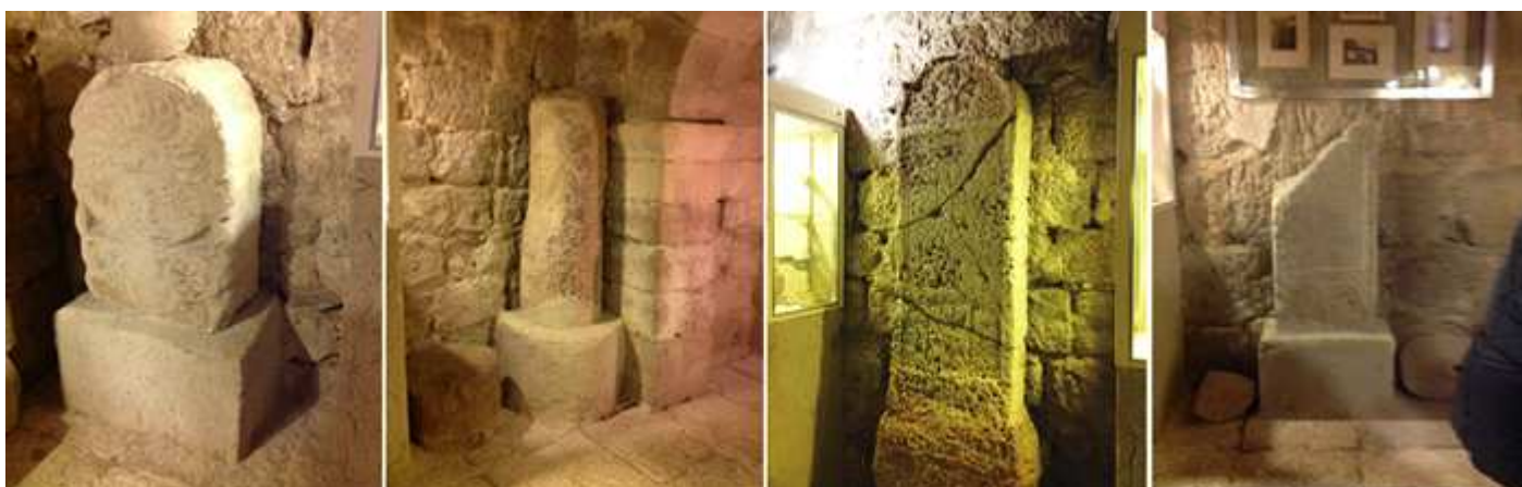
❶ Estela discoidal con un disco solar con radios dextrógiros, bajo el disco su vástago recto muy corto (posible fragmentado) en su frontal, a los lados dos rosáceas de seis pétalos. ❷ Miliario. ❸ Estela de gran tamaño fragmentada en el arco superior dispone de una rosácea de seis pétalos, y en el espacio central una inscripción muy deteriorada, parece ser piedra ostionera. ❹ Estela con su parte superior fragmentada con una inscripción orlada con un cordón en su parte central y en la inferior. Dos arquillos de medio p.

En la sala de la época romana con restos arqueológicos de la necrópolis romana de Palencia Palantia , en una de sus vitrinas.