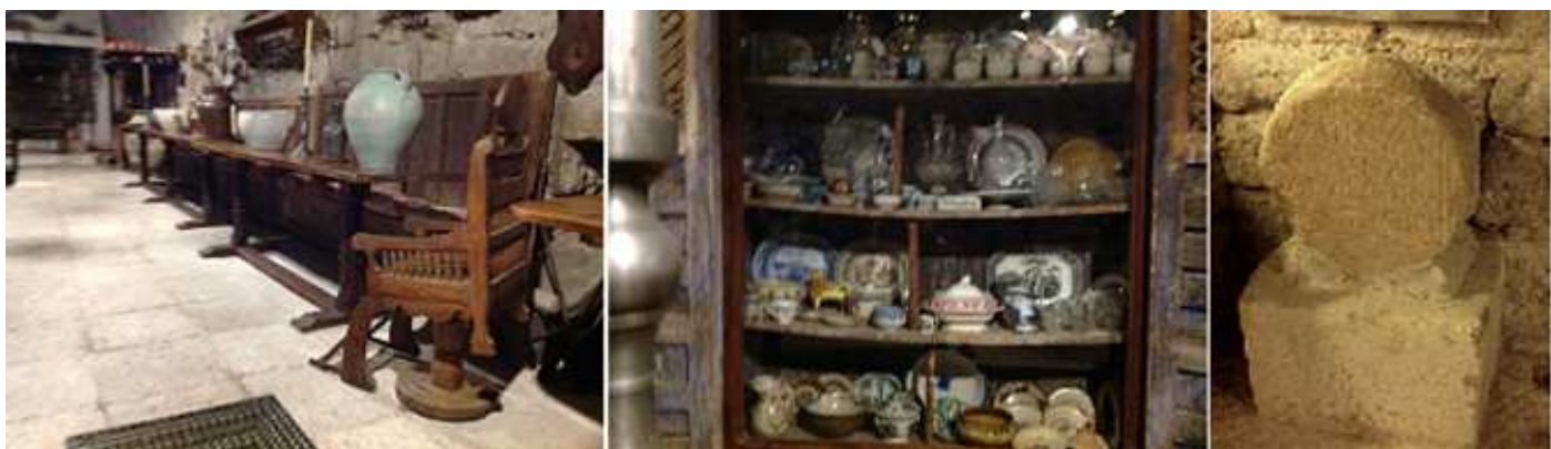
❶ Mobiliario y objetos variados. ❷ Estantería con cerámica y porcelana decorada. ❸ Estela discoidal con una inscripción en su interior está fragmentada y no posee vástago.

O los espacios de las cuadras y antiguas caballerizas y las zonas de servicio de esta planta baja.