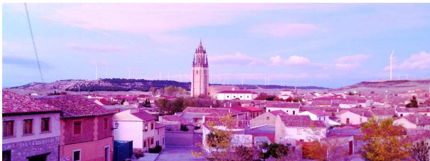
1 Vista del caserío desde el castillo.

En las proximidades del castillo existió el barrio judío de la localidad