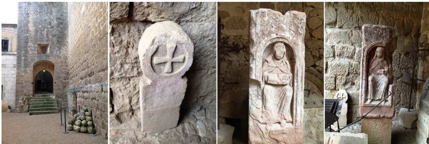
❶ Uno de los accesos de la plaza de Armas a la Torre del Homenaje. ❷ Estela discoidal con un grueso aro fragmentado y dentro una cruz patada con gran relieve con un vástago rectangular. ❸ Fragmento arquitectónico, de una columna ¿? Que en esta cara tiene una hornacina con una monja leyendo. ❹ Otra vista de otra cara de la misma columna.

La mayoría de piezas expuestas proceden de las localidades de la provincia de Palencia y otras que ha conseguido que volvieran a sus tierra.