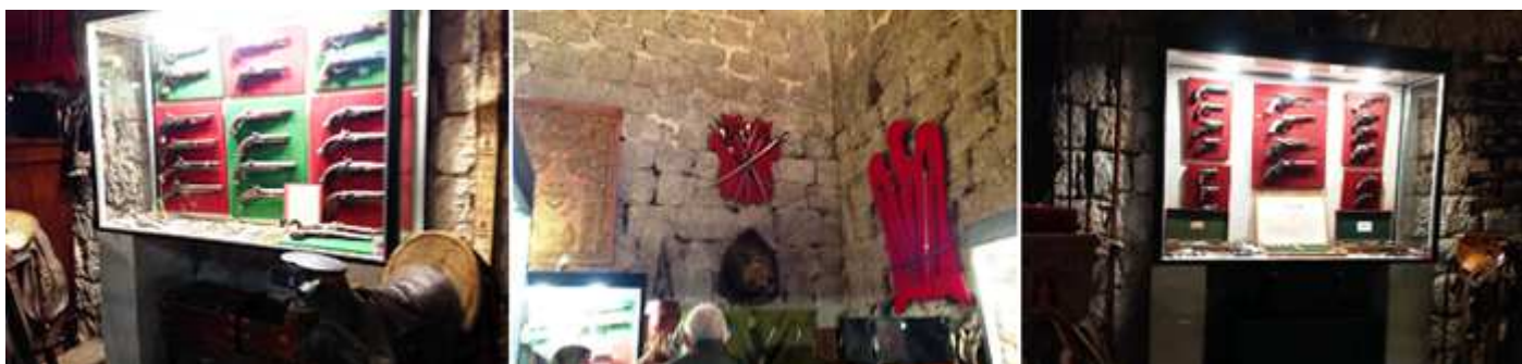
❶ Vitrina con dieciséis tipos de pistolas. ❷ En esta sala de armas en panoplias distintos juegos de espadas, armas blancas. ❸ Otra vitrina con pistolas. Posee una con cuatro cañones. Esta sala también tiene instrumentos musicales.

En la farmacia se recrea una de la época, que dispone de una silla de amputaciones.