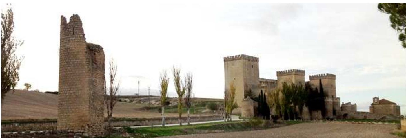
❹ Otro de los cubos aislado a la entrada que lleva al castillo.

Durante la Guerra de las Comunidades se asalto la villa, por lo que fue destruida ambas cercas. Esta disponía de seis puertas de acceso.