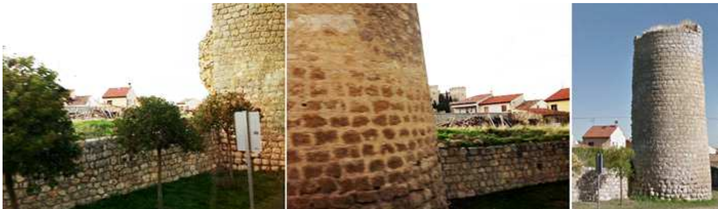
❶ Cubo de la muralla en la carretera que va a Vitoria de Alcor. ❷ Su parte baja empleada como tapial. ❸ Uno de los cubos de ella.

Se conservan sus ruinas consolidadas en algunos tramos con algunos cubos aislados de gran altura. Conto la villa con un primer recinto a finales del S. XIII de la Cerca Vieja o Alcerca, como se la conocía. Y esta fue ampliada con la Cerca Nueva.