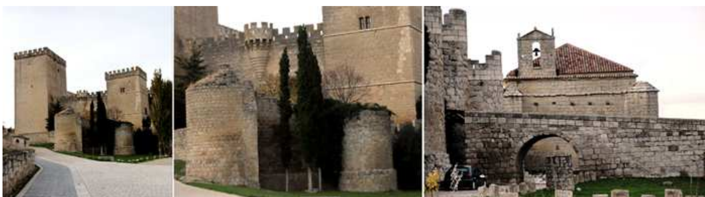
❶ A la izquierda la Torre del Homenaje. ❷ Dos de los cubos cilíndricos que rodeaban con sus murallas el castillo. ❸ Un tramo de la rampa con puente para acceder a su puerta. Que fue construido en 1538.

Está circunvalado por muros de barbacana con torres cilíndricas, y tiene una planta trapezoidal, ante su puerta el puente levadizo sobre el foso, con un patio interior y al suroeste tiene la Torre del Homenaje que alcanza hasta sus almenas 30m de altura, posee varios pisos, con bóvedas de crucería y escalera de mármol embebida en sus muros.