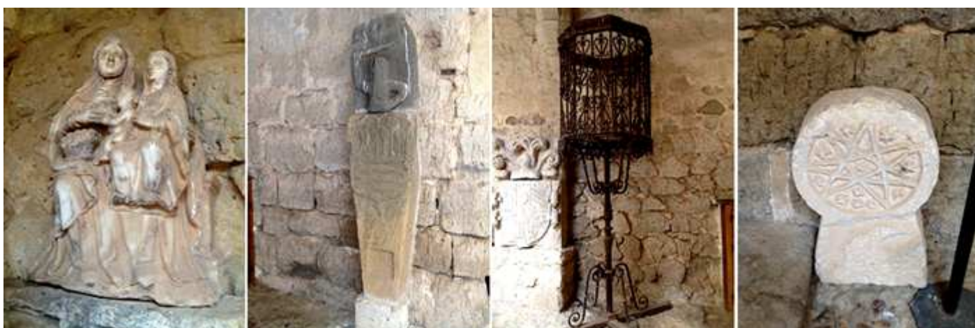
❶ La Virgen con el Niño con Santa Ana ¿?. ❷ Estela con un escudo ¿? Y un fragmento de un guerrero sobre la misma. ❸ Púlpito de forja. ❹ Estela discoidal con un aro y dentro una estrella en perfil cruzado de siete puntas en relieve, en sus espacios libres clavos de distinto tamaño con un vástago corto y acampanado.

La mayoría de piezas expuestas proceden de las localidades de la provincia de Palencia y otras que ha conseguido que volvieran a sus tierra.