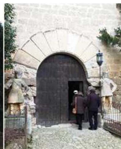
1 Puente de piedra elevado con una rampa en forma de L. Y entramos con un grupo. 2 Sobre la puerta dos matacanes redondos. Y el escudo del Duque de Lerma. 3 Y esta está construida con grandes dovelas lisas y custodiada, con dos guerreros de piedra.

Y entramos a su interior por un puente construido en 1538 que salvaba el foso que lo rodeaba. Y tras el puente el espacio levadizo ante su puerta. Le sigue un espacio que lo rodea con una barbacana almenada.