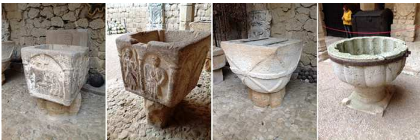
❶ Pila bautismal de piedra arenisca de taza cuadrada que en sus caras presenta uno o dos arcos con representaciones de animales y personas, no posee basa esta sobre un resto arquitectónico. ❷ Otras dos caras de esta pila. ❸ Pila bautismal de piedra arenisca de sección cuadrada superior pasa a troncocónica con unos bocelos cruzados y uno más grueso horizontal, no posee basa esta sobre una pieza arquitectónica, situada en la Plaza de Armas. ❹ Pila de piedra con gran taza semicircular con su exterior con anchos gallones en relieve y en el interior más pequeños y profundos sobre un corto fuste y descansa en una basa cuadrada con resaltes en sus ángulos, situada en la Plaza de Armas. Esta fragmentada y tiene una grapa horizontal.

Su patio de Armas que dispone de laterales con galerías abiertas en tres lados con arcos escarzanos. Con una decoración del gótico tardío.