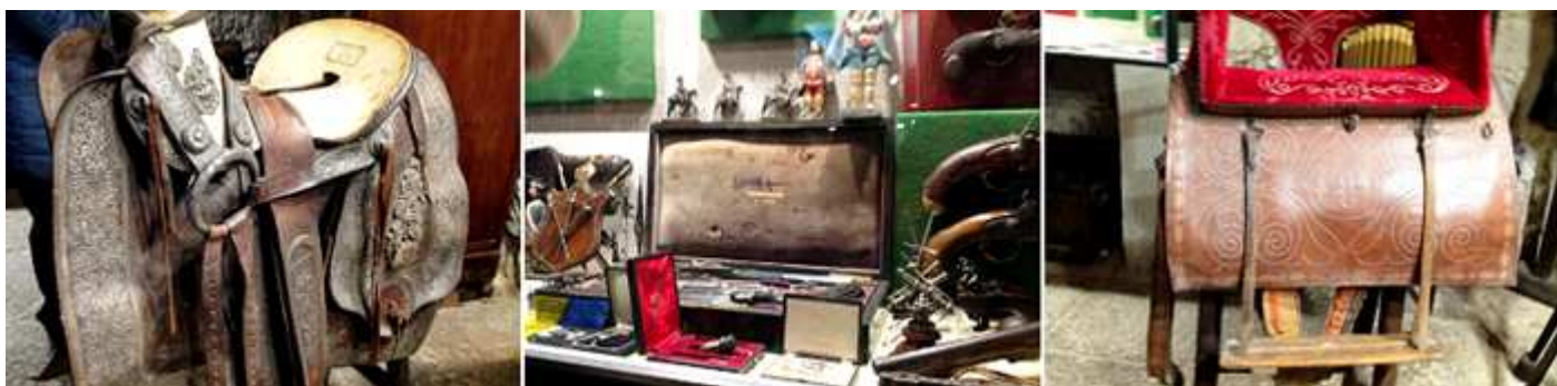
❶ Silla de montar que todos los complementos de cuero están repujados en plata. ❷ Juegos de pistolas d. ❸ Silla de montar para una dama.

En la farmacia se recrea una de la época, que dispone de una silla de amputaciones.