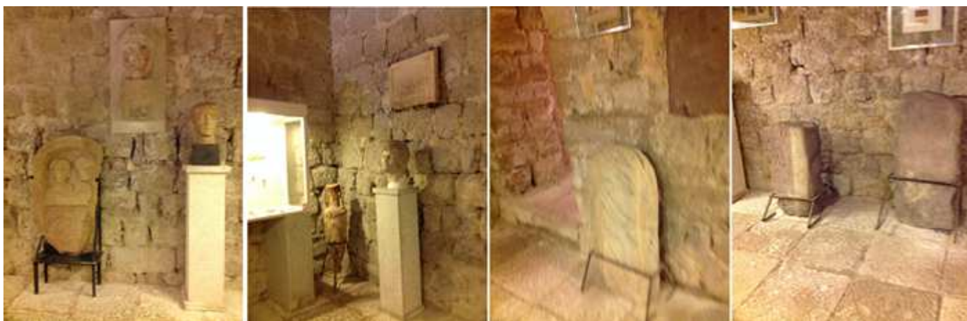
❶ Sala con objetos de la época romana, bustos, lápidas, etc. Entre ellos una estela con dos esposos. ❷ Ánfora, lápida, busto... ❸ Estela con una laja. ❹ Hitos terminales romanos que limitaban las fronteras del imperio romano en tiempos del emperador Augusto, proceden de Juliobriga cerca de Herrera de Pisuerga.