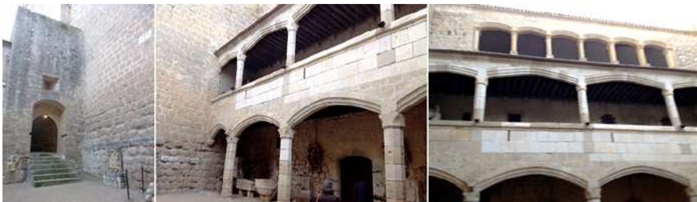
❶ Pared frontal de pario de Armas con uno de los accesos a su izquierda que en parte baja están las mazmorras. ❷ Detalle de sus galerías. ❸ Que dispone de tres plantas. La diferencia de tonos es por la restauración que se realizó en los años 60.

Todo el castillo está construido con piedra sillar, y algunas zonas con cantería irregular. En este castillo en las 60 del siglo pasado se rodó algunas escenas del rodaje de “El Cid” en el que participo Charlton Heston y Sofía Loren.