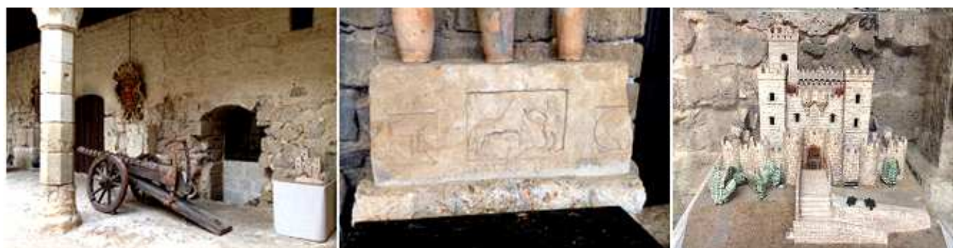
❶ Planta baja de una de las galerías con este cañón. ❷ Frontis labrado de 1664 con varias figuras. ❸ Maqueta del castillo en la recepción.

Además de las Piñas bautismales, se encuentran escudos nobiliarios y piezas funerarias como sepulcros y estelas, junto con miliarios de época romana.