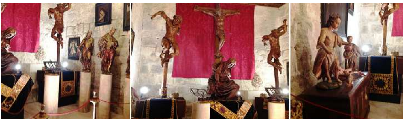
❶ Con vestuario y objetos litúrgicos. ❷ Calvario en madera de nogal de estilo manierista, obra de Juan de Ancheta del S. XVI. ❸ Otras imágenes y hay una caja fuerte del S. XII.