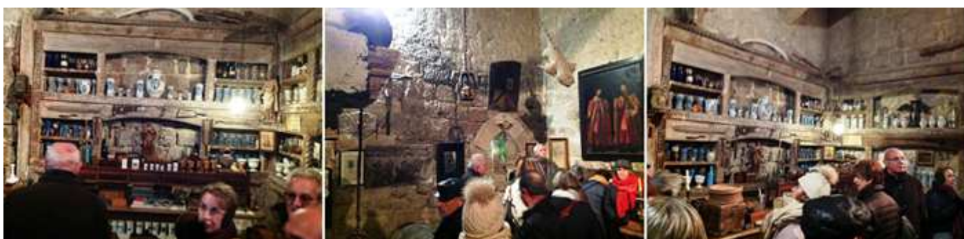
❶ La sala de la botica, con albarelos de Talavera de la Reina. ❷ Con todo tipo de objetos de farmacia y otros. ❸ Y una variada colección de botes de farmacia en cristal y cerámica. En esta sala tiene colgada la piel de una anaconda de 5m.