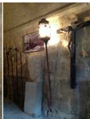
1 El que está situado a la izquierda. 2 Perímetro interior entre esta línea de almenas y torreones y el propio castillo. 3 Una ara romana ¿? convertida en limosnero. 4 A los lados del portón de entrada toda clase de objetos y entre ellos un Santo Cristo.

Y se llega a su Patio de Armas que no es muy amplio, y como ya hemos detectado tras su entrada, esta convertido en un museo, pero con las piezas dispersas sin orden ni datación de las mismas por la importancia de algunas.