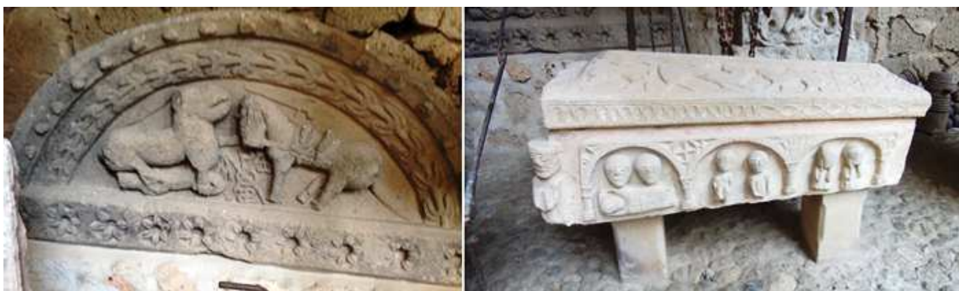
❶ Tímpano de la puerta de la torre perteneciente a la iglesia románica de San Julián, de Santa Cruz de Mena. S. XII. Rodeado con un guardapolvo con bolas (o puntas de diamante ¿?) y un arco con un tallo de hojas dobles sobre la escena interior de un león que abre su fauces enseñando los dientes, con el jinete hollado a sus pies y frente a él, un caballo con bridas y ensillado con una espada encima del caballo. en el espacio entre los animales un crismón de seis brazos con A a Alfa, y \Omega \omega Omega pinjantes de los cruzados, la P sobre el superior y la S enroscada e invertida del inferior con un círculo en el cruce de los brazos, sobre el dintel con diez flores hexapétalas. ❷ Sepulcro con tapa que posee tres animales una estrella de ocho puntas y una rosácea de seis pétalos, en su frontal, el posible finado y tres arcos con escenas de velando al difunto, dos personas desnudas masculinas, y dos femeninas posibles lloronas.