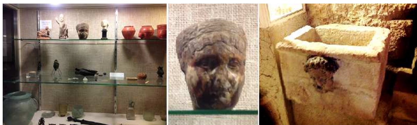
❶ Antigua Colección de Simón Nieto. Con objetos de la necrópolis de Palencia. Y que se relacionan con los ritos funerarios. En el ángulo superior izquierdo hay un grupo de divinidades romanas. Esta vitrina como otra que hay de la colección Monteverde se compraron para integrarse con objetos romanos, visigodos, etc. ❷ Una cabeza de esta colección. ❸ Pila romana ¿?