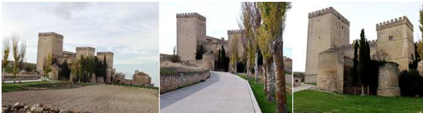
❶ Paisaje con el castillo. ❷ Un paseo arbolado nos conduce al mismo. ❸ De sus cerca perimetral conserva estos cubos.

Está circunvalado por muros de barbacana con torres cilíndricas, y tiene una planta trapezoidal, ante su puerta el puente levadizo sobre el foso, con un patio interior y al suroeste tiene la Torre del Homenaje que alcanza hasta sus almenas 30m de altura, posee varios pisos, con bóvedas de crucería y escalera de mármol embebida en sus muros.