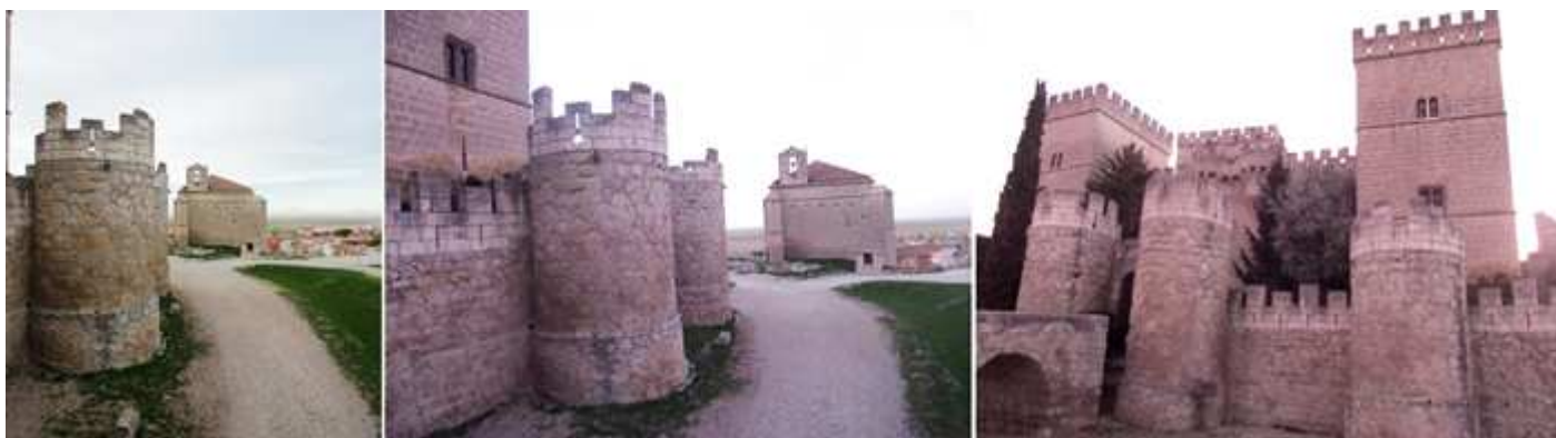
❶ Uno de los cubos exteriores. ❷ Con lienzos de barbacanas se saltean su torres, al fondo la ermita de Santiago. ❸ Vista frontal, tras el puente disponía otro levadizo.