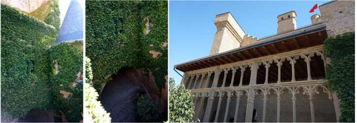
❶ Muros cubiertos de vegetación desde la parte superior del patio de la Morera. ❷ Y que continúan hacia la Galería del Rey. ❸ Esta galería provista de tres tramos con dos pisos de arcos góticos.

Ya en 1556 necesitaba importantes reparaciones, lo mismo que en 1662 tras sufrir expolio y robos. Culminado con el incendio propiciado por Espoz y Mina en la Guerra de la Independencia 1813.