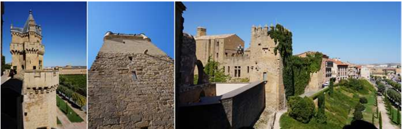
❶ Al fondo la torre de las Tres Coronas. ❷ Torre Homenaje. ❸ A la izquierda el arco de las ruinas de la capilla y una de las torres del palacio de los Teobaldo.