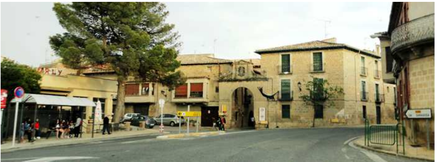
📍 Panorámica a la entrada de la localidad. Con el portal de Tafalla que adentrándose por el mismo es recorrer la parte antigua, era una de las puerta que tenía la cerca, es de estilo herreriano.

En 1147 Olite experimento un importante crecimiento, por lo que su expansión rompió los límites o “Cercos de Fuera” gracias a la concesión del fuero de Estella por parte de García Ramírez, desde el XIII fue una de las sedes de los reyes navarros y hoy podemos apreciar algunos de los monumentos de estas épocas.