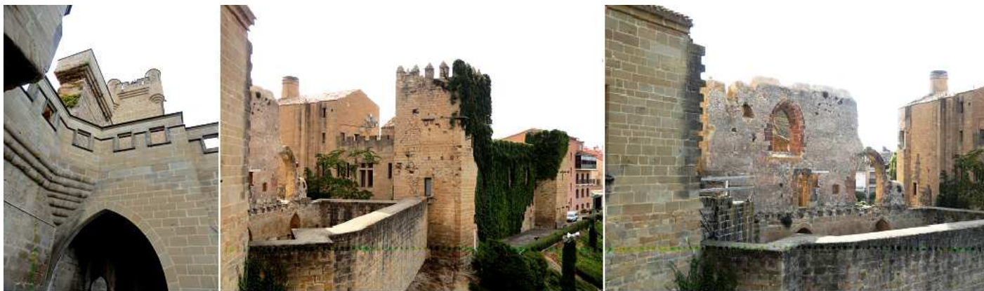
❶ Paso a través de este arco apuntado. ❷ Ruinas de la Capilla de San Jorge con el Palacio Viejo al fondo. ❸ Otra imagen de las ruinas de la capilla, que se construyó a finales del S. XIV, debajo de ella se conservan las bodegas del Palacio.

las Tres Coronas y el Depósito del hielo (donde mediante capas de nieve la guardaban el resto del año para conservar los alimentos).