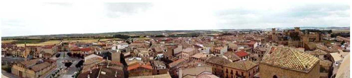
📍 Panorámica de Olite desde la torre de la iglesia de San Pedro.

Olite conserva el trazado medieval en su casco antiguo, mayormente construido con piedra sillar.