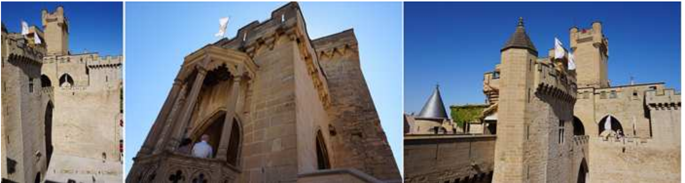
❶ Espacio por el portal en la parte inferior. ❷ Galería gótica en la torre de los Cuatro Vientos. ❸ En la parte superior camino a la torre del Homenaje.