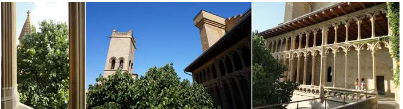
❶ Vista a través de uno de sus ventanales, ❷ Al fondo la imagen de la torre gótica de Santa María. ❸ Esta galería fue construida a finales del S. XV.

Esta galería del Rey daba al patio de los Naranjos (llamado de los Toronjales) y cuentan que estos eran cubiertos con esteras de esparto para protegerles del frío clima invernal.