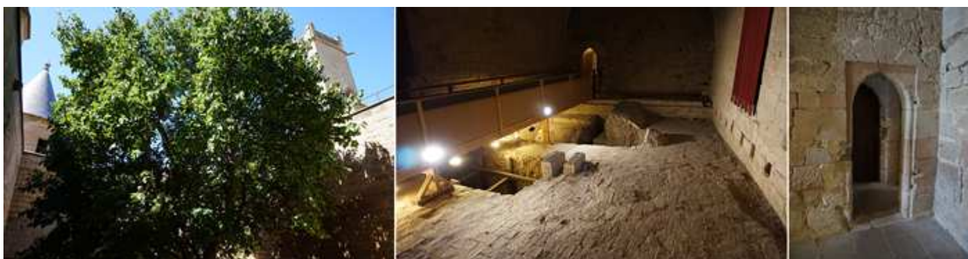
❶ La Morera que ocupa casi este pequeño patio. Árbol que podría tener unos 500 años. ❷ Estancia con las excavaciones que pasa por una pasarela. Esta era la sala de Guardia. ❸ Con esta puerta al fondo.