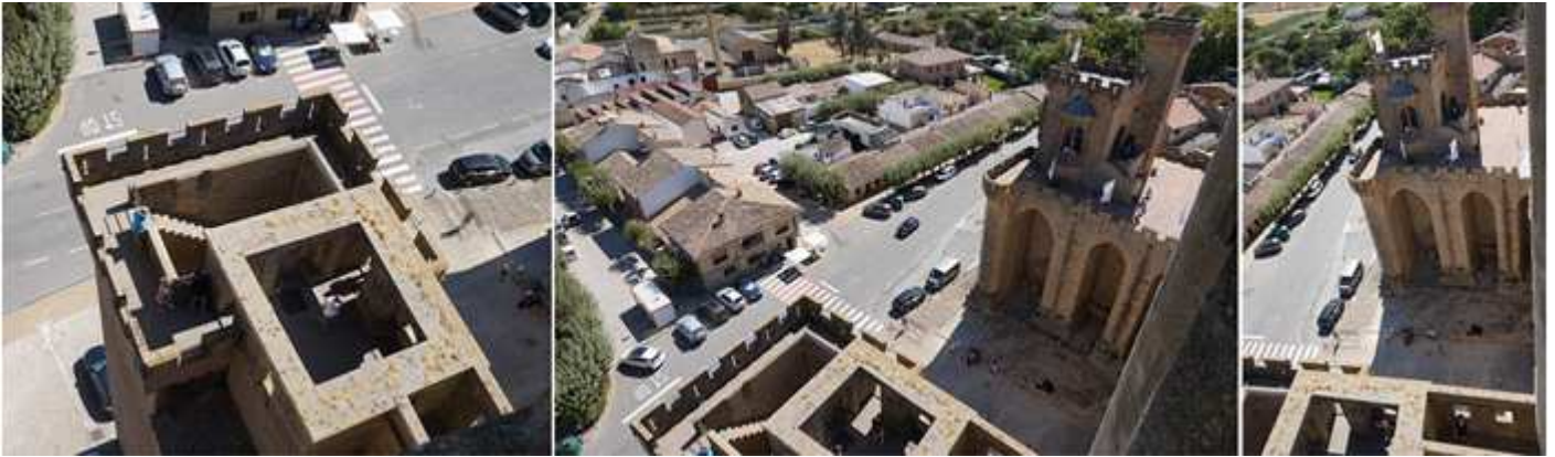
① Paseo de ronda de la Torre de los Cuatro Vientos. ② En frente la torre de la Atalaya. ③ Esta es la parte posterior del palacio y en este espacio suelen hacer en veranos los festivales.

El esfuerzo de subir a la torre se ve compensado con creces por las formidables vistas de 360° que aporta.