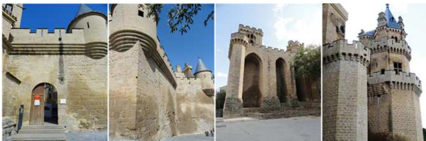
❶ Entrada al Palacio. ❷ Lienzos exteriores. ❸ Parte posterior, junto al arco de entrada a Olite. ❹ Torre de las Tres Coronas

Junto a él está el palacio Viejo, que hoy esta convertido en Parador.