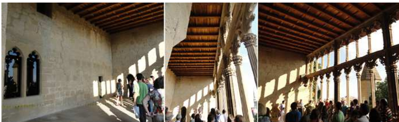
❶ Lateral opuesto a la arquería del mirador con dos ventanas. ❷ Las finas columnillas. ❸ De los arcos trilobulados.

Sus patios con jardines inspirados en el gótico francés le confieren un especial encanto teniendo en cuenta que fue una de las sedes de la Corte del Reino de Navarra. Y tenían estos nombres: huerto de los naranjos , huertecillo de los baños , jardín del cenador y jardín de los toronjales . Recordemos que los construyó Carlos III en 1406 de vuelta de su viaje a Francia.