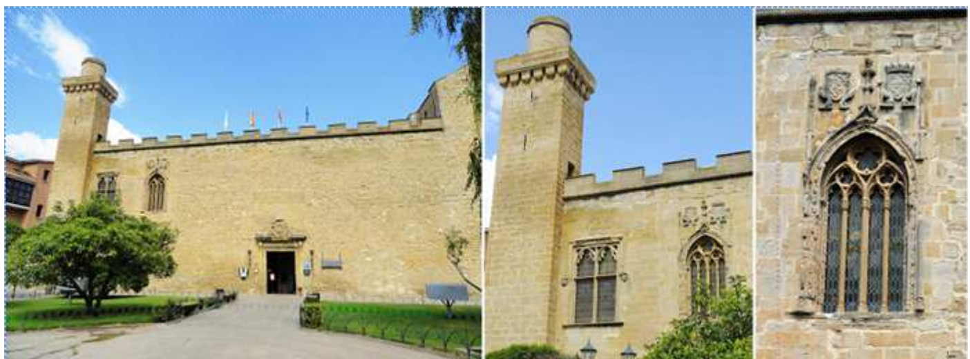
❶ Fachada del Palacio Viejo ❷ Ventanas que dan al Salón de Cortes. ❸ Escudos con las armas de Navarra y Evreux. Su origen se traslada a la época romana y era la fortaleza, después fue utilizado por los visigodos, y con la existencia de la monarquía navarra, a residencia desde Sancho III el Fuerte. Hoy en día es el parador nacional. Del periodo medieval se conserva su exterior, la torre de la guardia o prisión, y el ventanal del Salón de Cortes, estos son de 1414. En el reinado de Felipe II, en 1584 se construyó la puerta que da acceso.

Tomamos la arteria de la plaza Carlos III El Noble, para acceder a este castillo que en realidad es un palacio cortesano.