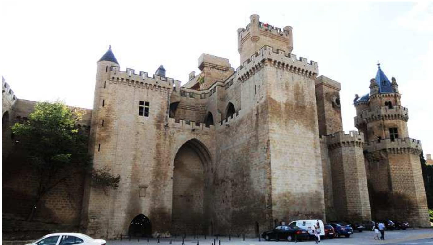
❶ Parte posterior del castillo, en esta zona que se encuentra en el Paseo de Doña Eleonor, que también es la NA-5303, es el sitio idóneo para aparcar el coche.

El palacio de los Reyes de Navarra, es una joya en su género, construido durante los S.XIII y XIV durante algún tiempo a partir del Carlos III, fue sede de las cortes del Reino. Que perfectamente conservada ha llegado hasta nuestros días y que merece una detenida visita del mismo.