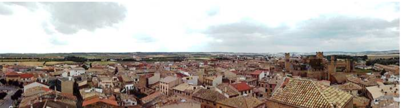
① Panorámica de Olite desde la torre de San Pedro con el castillo-palacio a la derecha.