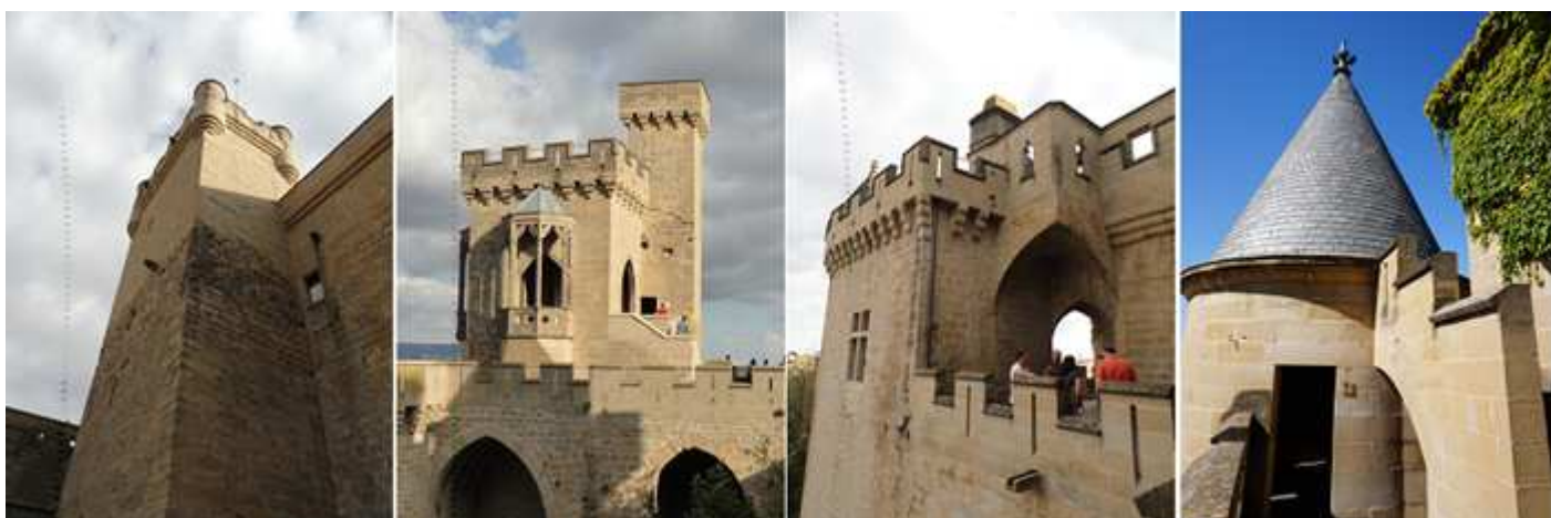
❶ La Torre del Homenaje que tiene 40m de altura, y está rodeada en sus ángulos con torreones circulares. ❷ Torre de los Cuatro Vientos o de las Tres Finestras. ❸ Paso entre las torres. ❹ Uno de los torreones circulares con su tejado de pizarra.

Podemos ver en esta parte a la izquierda las ruinas de la capilla del castillo y en frente el plació Viejo, hoy día parador Nacional (al que sugiero su entrada al mismo, aunque solo sea tomar un café).