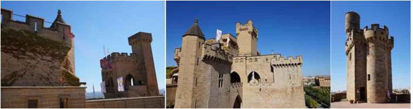
❶ A la derecha la Torre de los Cuatro vientos. ❷ Después de la visita guiada se puede disfrutar del recorrido por las plantas superiores del castillo y más si sale un día fenomenal como este. ❸ Torre de la Atalaya, o de la Joyosa Guarda es una de las más atractivas.