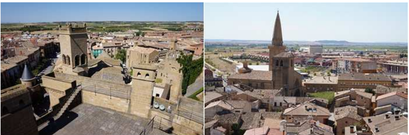
❶ A la izquierda la torre campanario de Santa María. ❷ La aguja de la torre de San Pedro y junto a la iglesia por este lado posee su claustro.