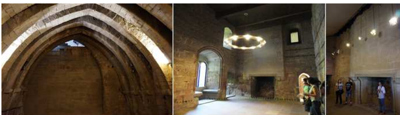
❶ Bóveda apuntada con arcos fajones de la sala de los arcos, sobre esta sala soportaba el peso... están los jardines ❷ Cámara de la Reina con un ventanal mirador y chimenea. ❸ Lateral donde dispone de una gran chimenea en la Sala de los Lazos.