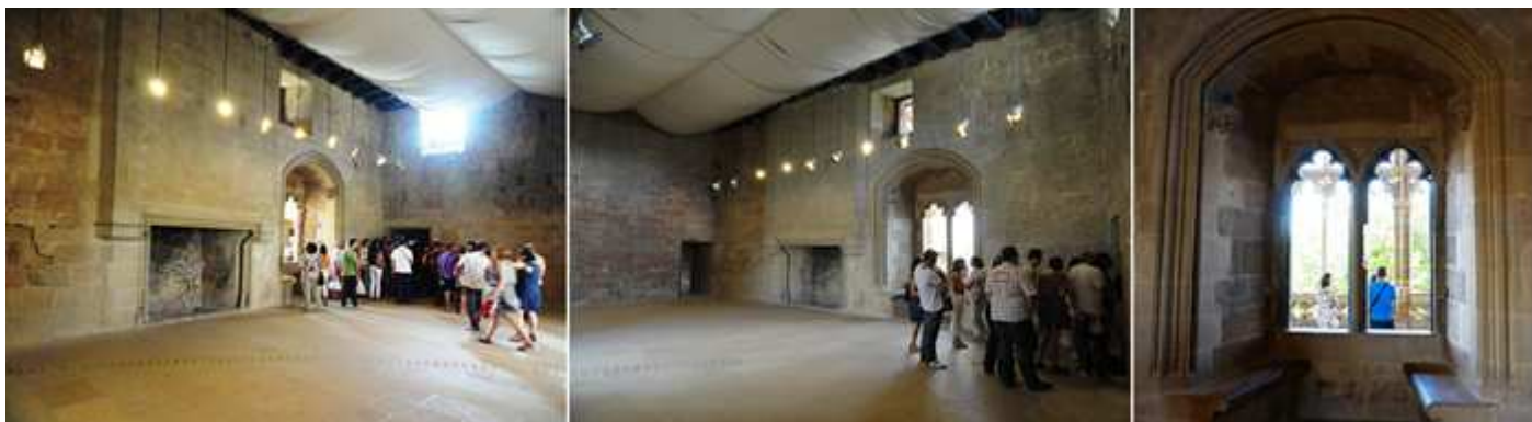
❶ La chimenea que caldeaba esta estancia con ventanales góticos. Que esta contigua la Cámara de la Reina. ❷ Este era el salón de recepción de invitados. ❸ Mirador con una doble ventana con arcos polilobulados. También se conoce esta sala como la Cámara de los Lazos, la decoración que tenía su artesanado con lazos tallados. Estos eran unos de los símbolos del reinado de Carlos III.

Uno de los salones de mayor tamaño es la cámara del Rey o de los Lazos, con grandes ventanales góticos y una gran chimenea, el nombre de los lazos proviene del su artesanado donde estaba completamente tallado con este símbolo, del reinado de Carlos III, con el techo dorado. Anexa a esta cámara estaba el dormitorio del rey.