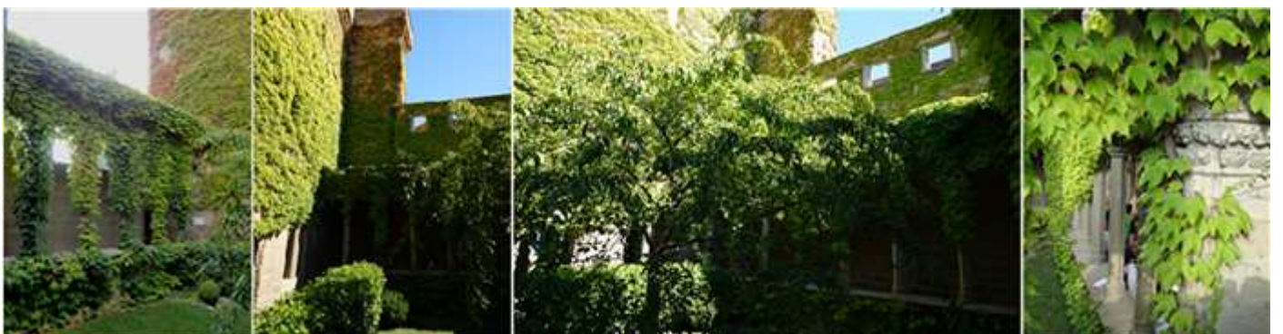
❶ Galería de la Reina. ❷ Que sus lados y arcos esta cubiertos de vegetación. ❸ Una de las pandas del lado derecho. ❹ Detalle de las columnas no cubiertas por esta manto verde.

Carlos III vivía en el con su esposa doña Eleonor de Trastámara. La Galería de la Reina es un jardín colgante, con forma de un pequeño claustro con sus galerías arqueadas, y casi cubiertas completamente por la vegetación.