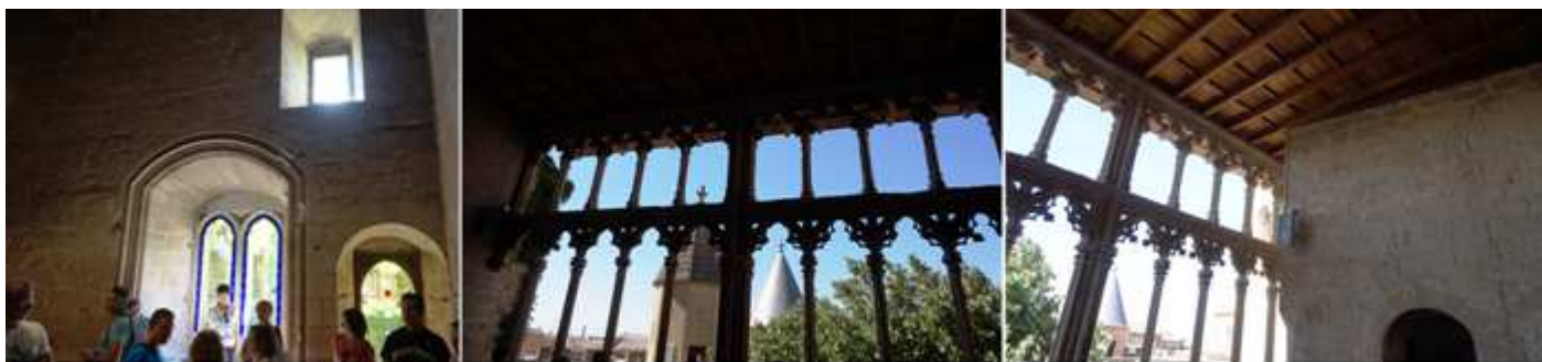
❶ Lateral con un ventanal y la puerta de salida a la Galería. ❷ Esta galería estuvo cerrada con cristales para soportar los fríos inviernos o corrientes de aire. ❸ Artesonado del mirador, y la preciosa tracería de sus arcos.

Tras ella salimos a la galería del Rey con una tracería de arcos, que originalmente estuvo cubierta con cristales de colores.