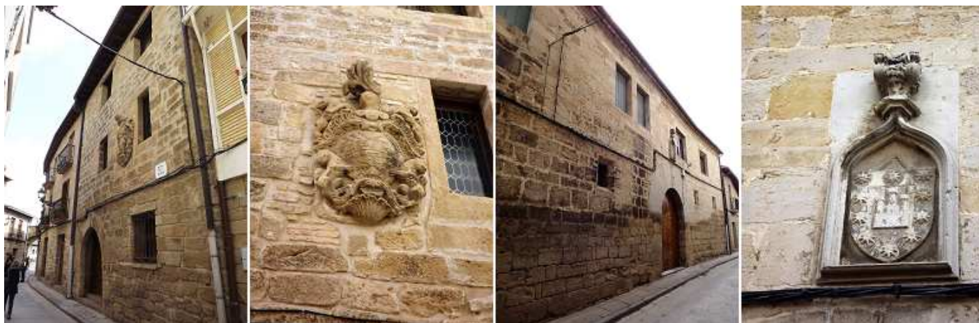
❶ Rúa del Pozo nº 3. H.1200

Tomamos la Rúa del Pozo... donde por estas calles del casco viejo apreciaremos las numerosas casonas y palacios.