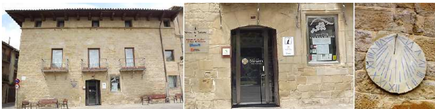
❶ Oficina de Turismo, fachada de lo que fue el colegio de chicas del Arzobispado de finales del S. XVI-XVIII. ❷ Portada de arco rebajado. ❸ Reloj de sol en la fachada. Tipo: vertical, radial. Con las horas y números pintados. Traza: de las 7 a las 6 h. p.m. en números romanos con las trazas también de las medias. Gnomon de varilla.

Con dirección al centro y entrar en la oficina de Turismo que esta junto al Palacio Viejo o Palacio de los Teobaldos.