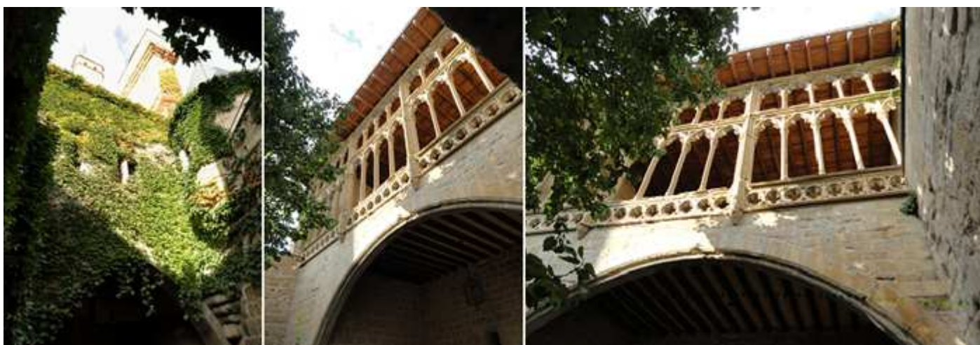
❶ Una parte del mismo cubierto por enredaderas. ❷ La arcada que sostiene el mirador. ❸ Sobre el mismo se encuentra la galería del Rey.

Entramos ahora a un pequeño patio, llamado de la Morera, para acceder a una sala donde están en plenas excavaciones en el subsuelo.