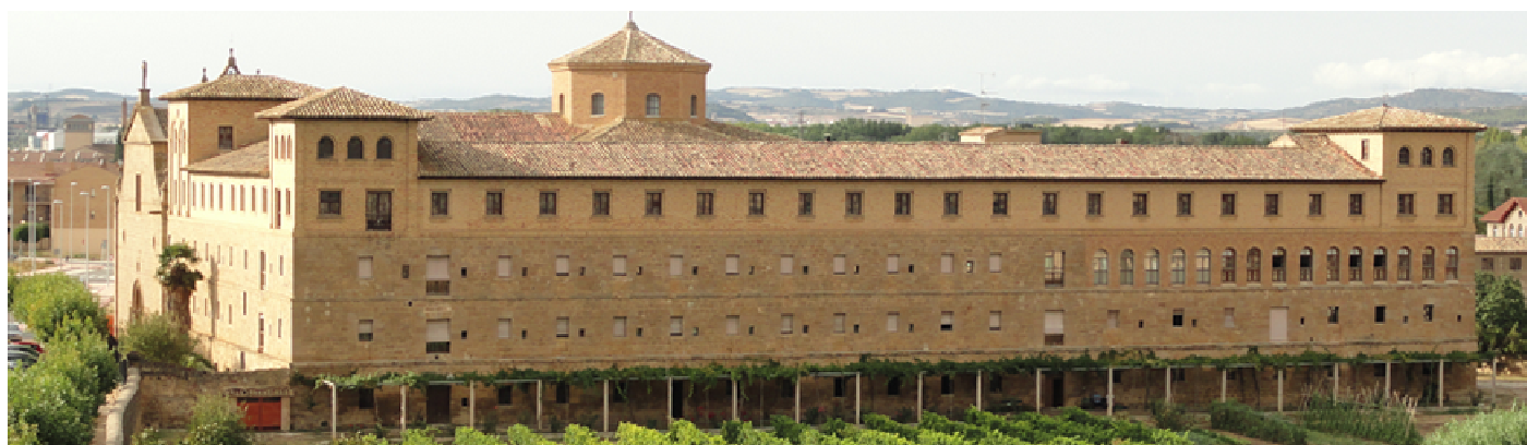
❶ Fachada del convento de San Francisco, ante las huertas que lo rodean.

Desde las almenas del castillo, se disponen unas vistas extensas, e incluyo una imagen del Convento de San Francisco (que no es visitable).