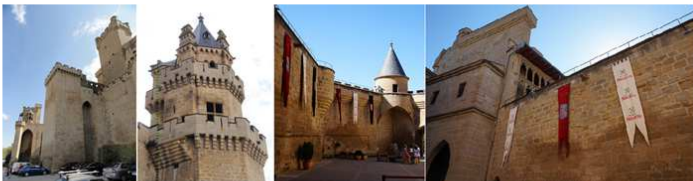
❶ Lateral de la zona de aparcamiento. ❷ Torre de las tres Coronas. ❸ Entramos y un lateral del patio de Armas esta adosado a la Iglesia de Santa María. ❹ El lateral opuesto y acceso al palacio.

Entramos ahora a un pequeño patio, llamado de la Morera, para acceder a una sala donde están en plenas excavaciones en el subsuelo.